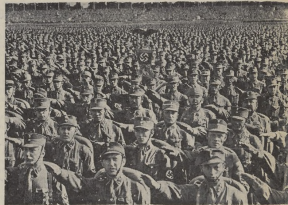
Parada de la S. A. (Sección Asalto) en Nuremberg

Salió con dirección a Portugal un grupo de flechas y cadetes de Falange Española Tradicionalista y de las J. O. N.-S., que invitados por el jefe de las Juventudes Hitlerianas, von Schirach, pasarán unas tres semanas en Alemania. En Lisboa embarcaron en el Cabo Norte , con rumbo a Hamburgo. Estos alegres muchachos, representantes de la juventud nueva es-