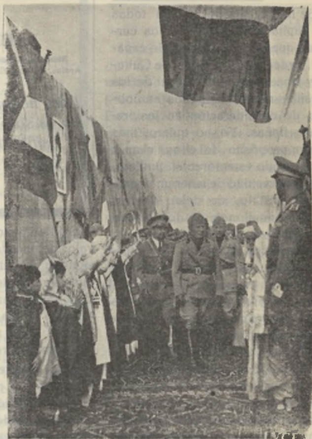
El Duce acompañado del General Balbo, en Tripoli, visitando un pueblo indígena.

El imponente acto demostrativo gimnástico coral, que ante