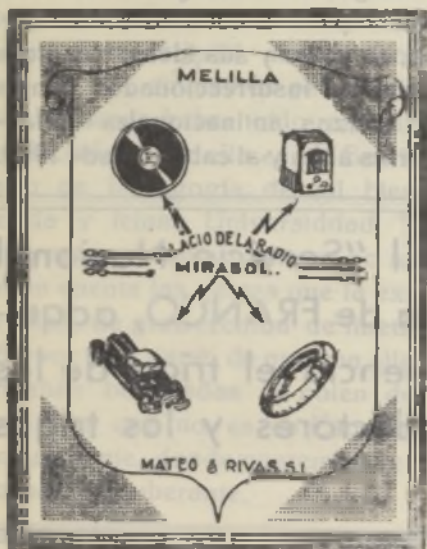
Accesorios para Autos y Radios Actor Tallaví, número 4 - Melilla