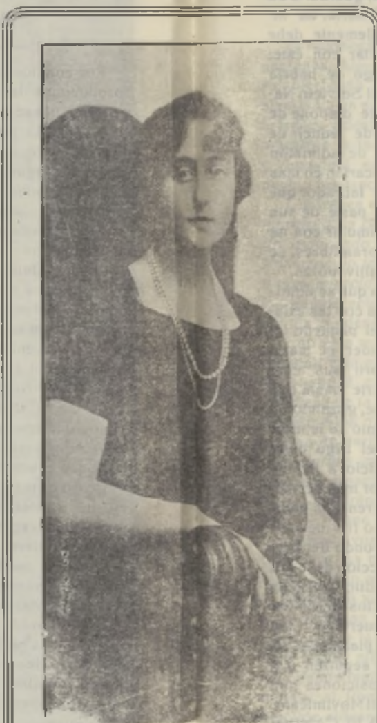
Pilar Primo de Rivera, Delegada Nacional de Sección Femenina de Falange, cuando aun no había vivido la tragedia de hoy, a quien el Generalísimo acaba de otorgar la Medalla de Sufrimiento por la Patria.

Las tiendas están cerradas. Los escaparates, de vidrios empañados, vacíos. En el ancho paseo frente al mar, orgullo ayer de la ciudad, sobre lo que eran céspedes, hileras y grupos de milicianos desarmados—harapos, barbas y miseria—nos miran de extraña manera. ¿Miedo? ¿Curiosidad? ¿Expectación?