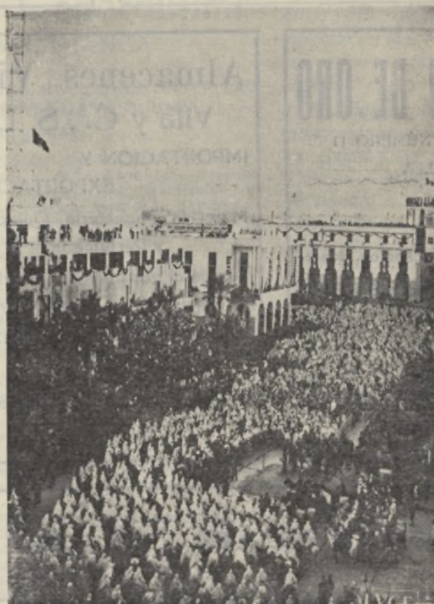
Multitud musulmana oyendo al Duce en Litria