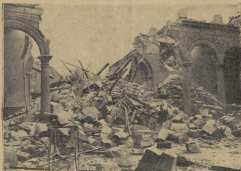
Esta es la entrada actual del Alcázar Toledano. Entrada hecha por las bombas y los cañonazos. Y así entre ruinas el coraje de los sitiados mantenía a raya a los miles de rojos separatistas que los asediaban.

Y en los vitores y en las aclamaciones del buen pueblo belga a sus legionarios, iba implícita esa adhesión colectiva de la masa, que es algo metafísico e impalpable, pero que cristaliza indefectiblemente, cuando una causa es justa, con ese muro formidable que se llama «Conciencia Nacional».