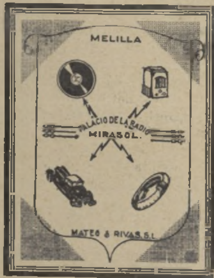
Accesorios para Autos y Radios Actor Tallavi, número 4 - Melilla