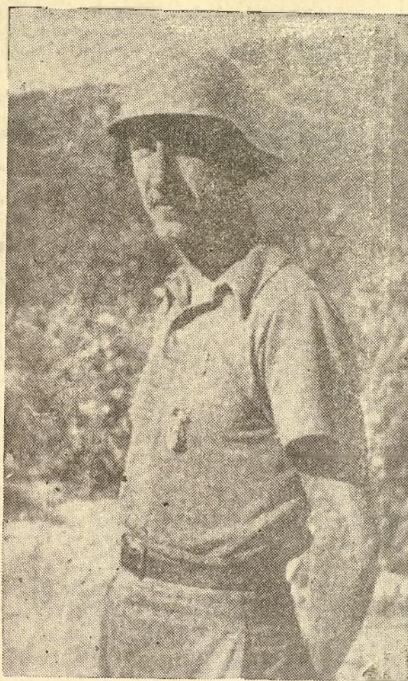
El príncipe español don Carlos de Borbón y Orleans, muerto gloriosamente por la Patria, el 27 de Septiembre de 1936 en el frente de Eibar por cuyo eterno descanso se celebraron solemnes funerales en la Iglesia Colegiata de Vigo.

Los diez mandamientos de Dios, son el código