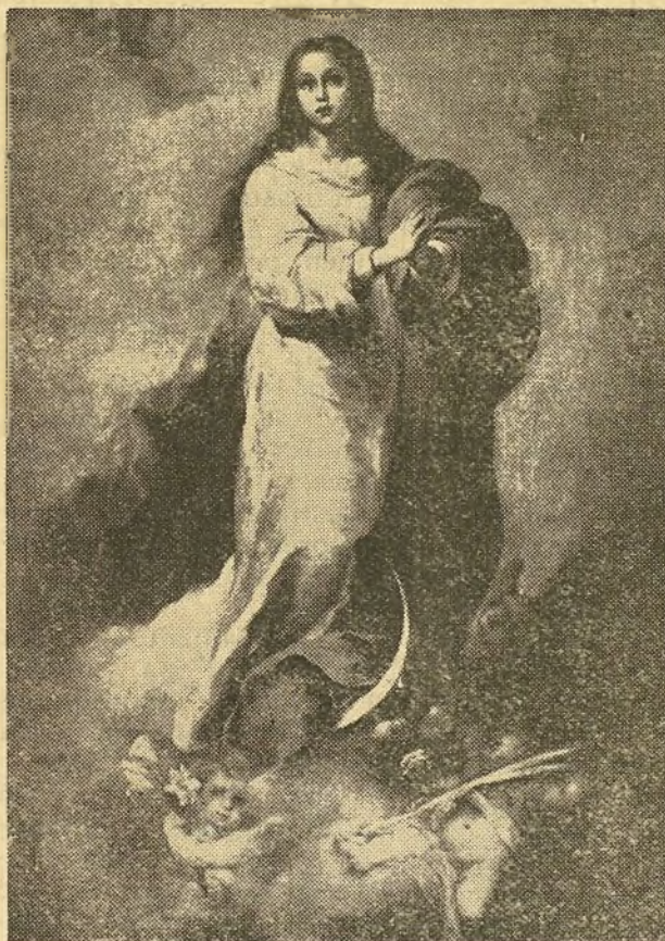
La Concepción de Murillo del Museo del Prado.—Madrid

¡Sí, así!... Es buena señal. Vamos bien... cuando los príncipes