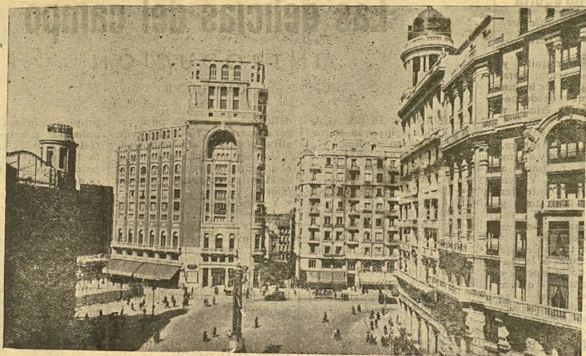
Madrid.-Una vista de la Plaza del Callao.