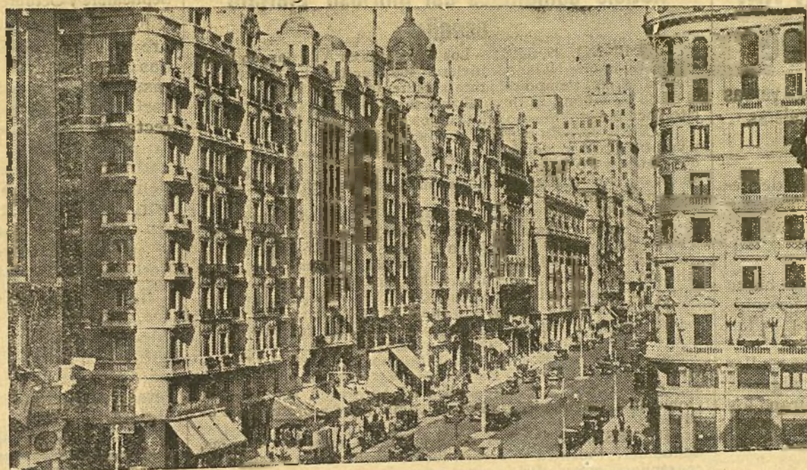
Madrid.--Una parte de la Gran Vía.