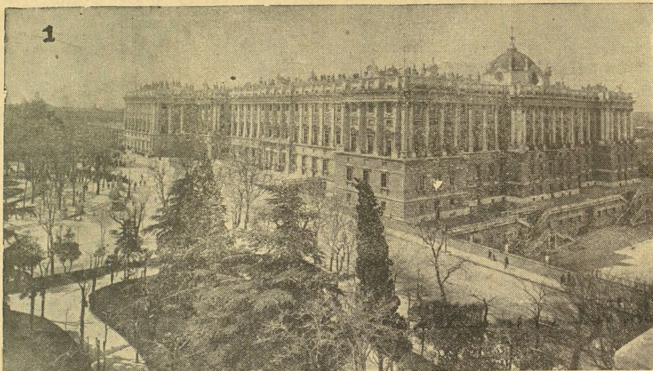
Madrid.—Una vista del Palacio Real.