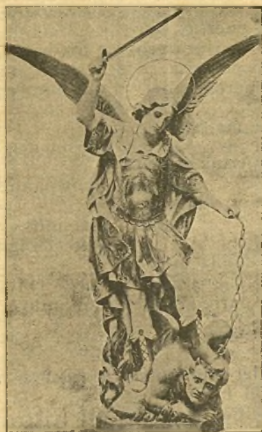
San Miguel Arcángel, ruega por nosotros

SAN MIGUEL ARCÁNGEL, ruega por nosotros.