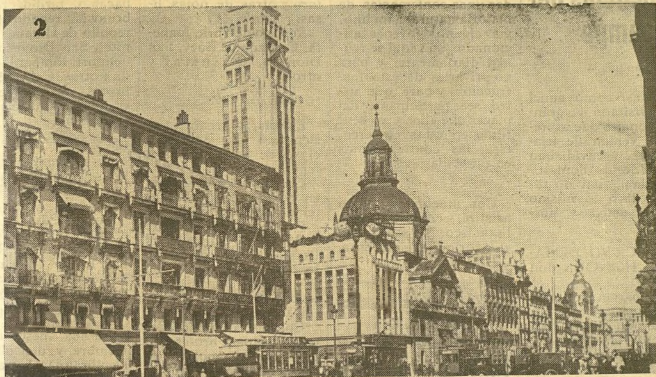
Madrid.--Una vista de la calle de Alcalá.