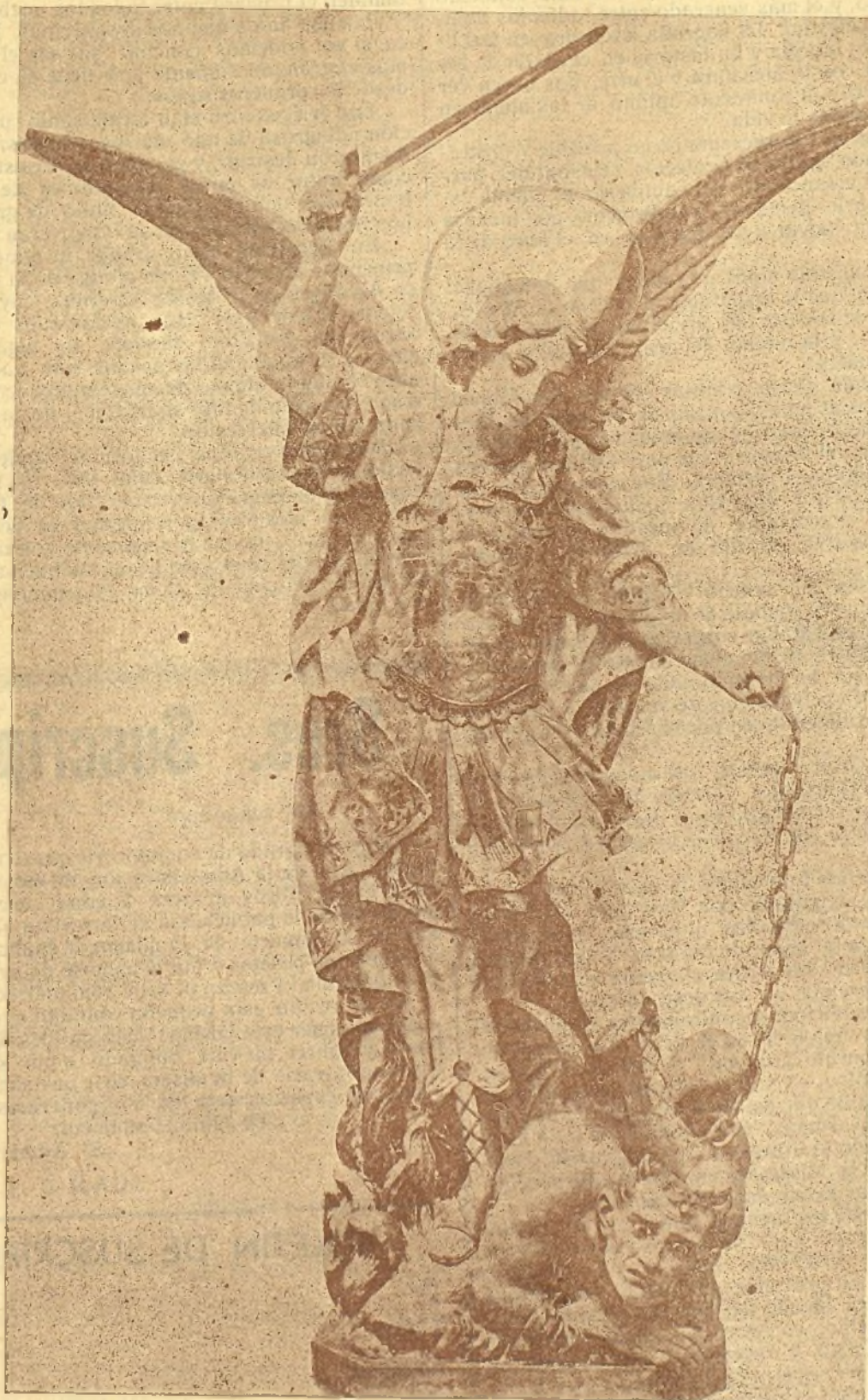
SAN MIGUEL ARCANGEL