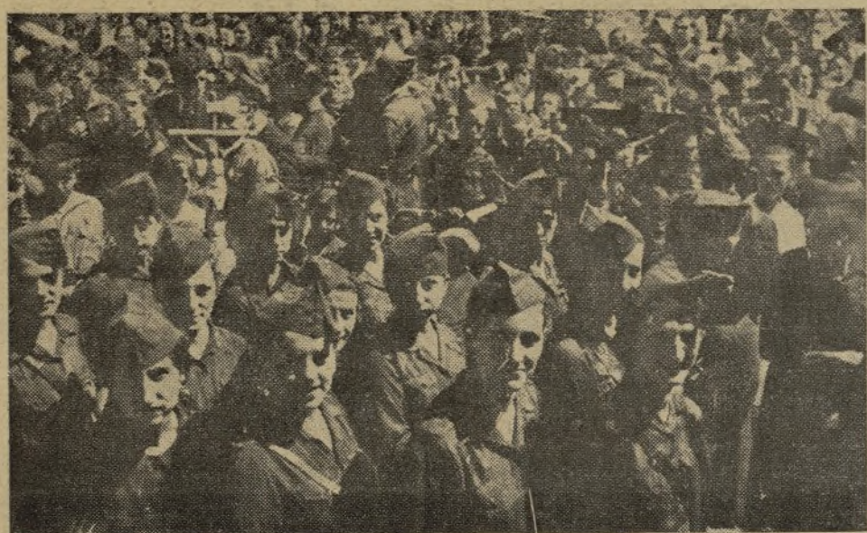
Las falanges en un momento de la reposición de crucifijos en las Escuelas Nacionales.