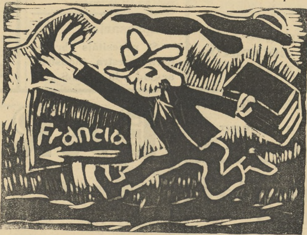
Andando:—Companys!!... A les armes!!...

De la prensa: «Companys ha salido hacia Perpiñán»