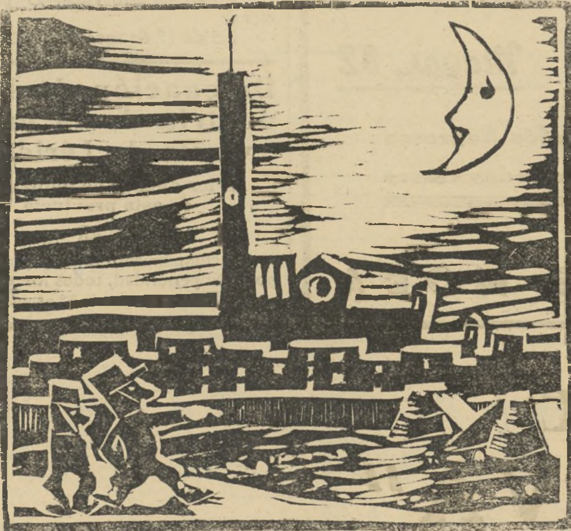
EN LA OTRA ORILLA

Jerusalén, 16.—En Haifa un autobús fué atacado por una banda de árabes, resultando diez muertos