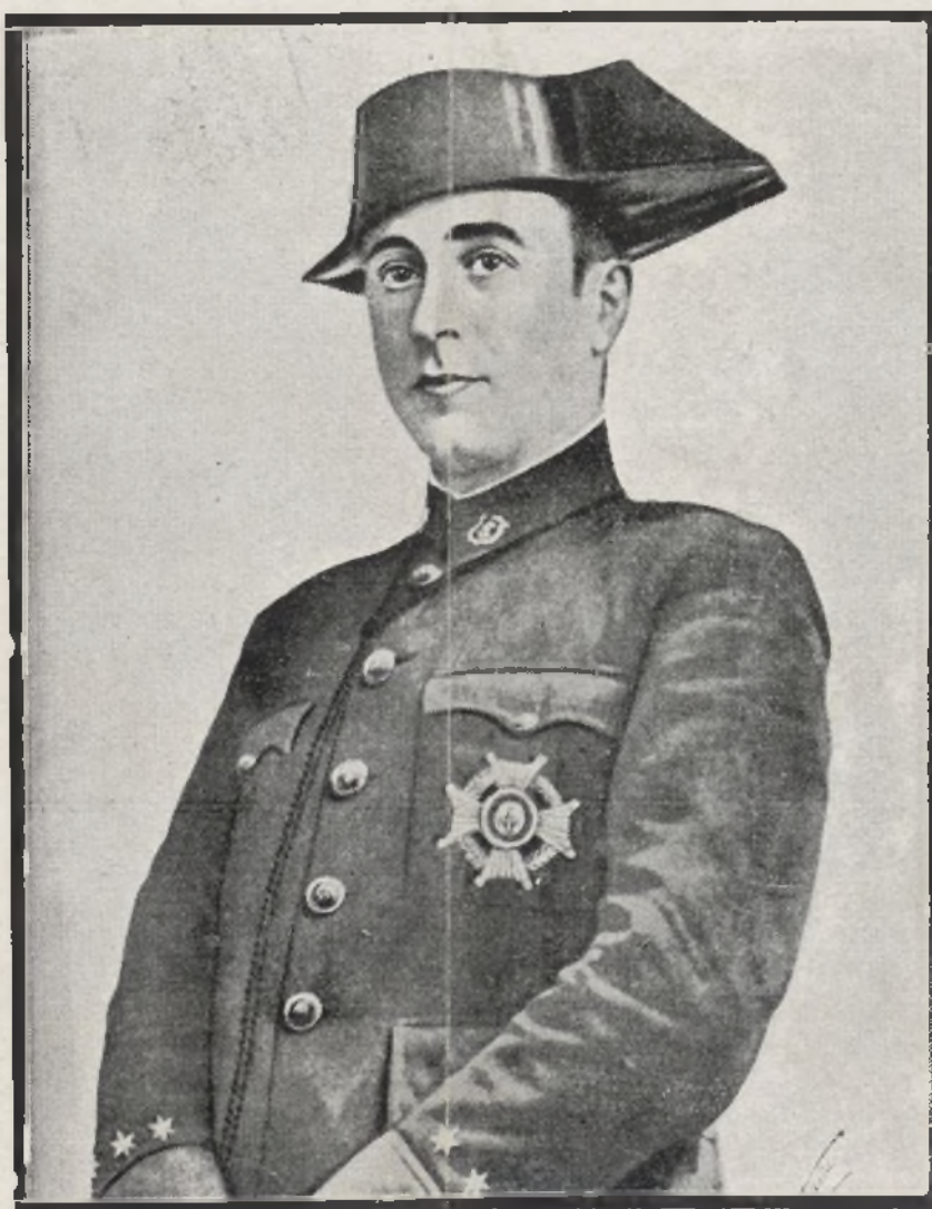
† EL CAPITÁN CORTÉS

Héroe y mártir del Santuario de la Virgen de la Cabeza