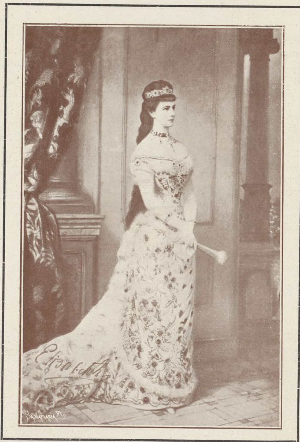
La Emperatriz Isabel.