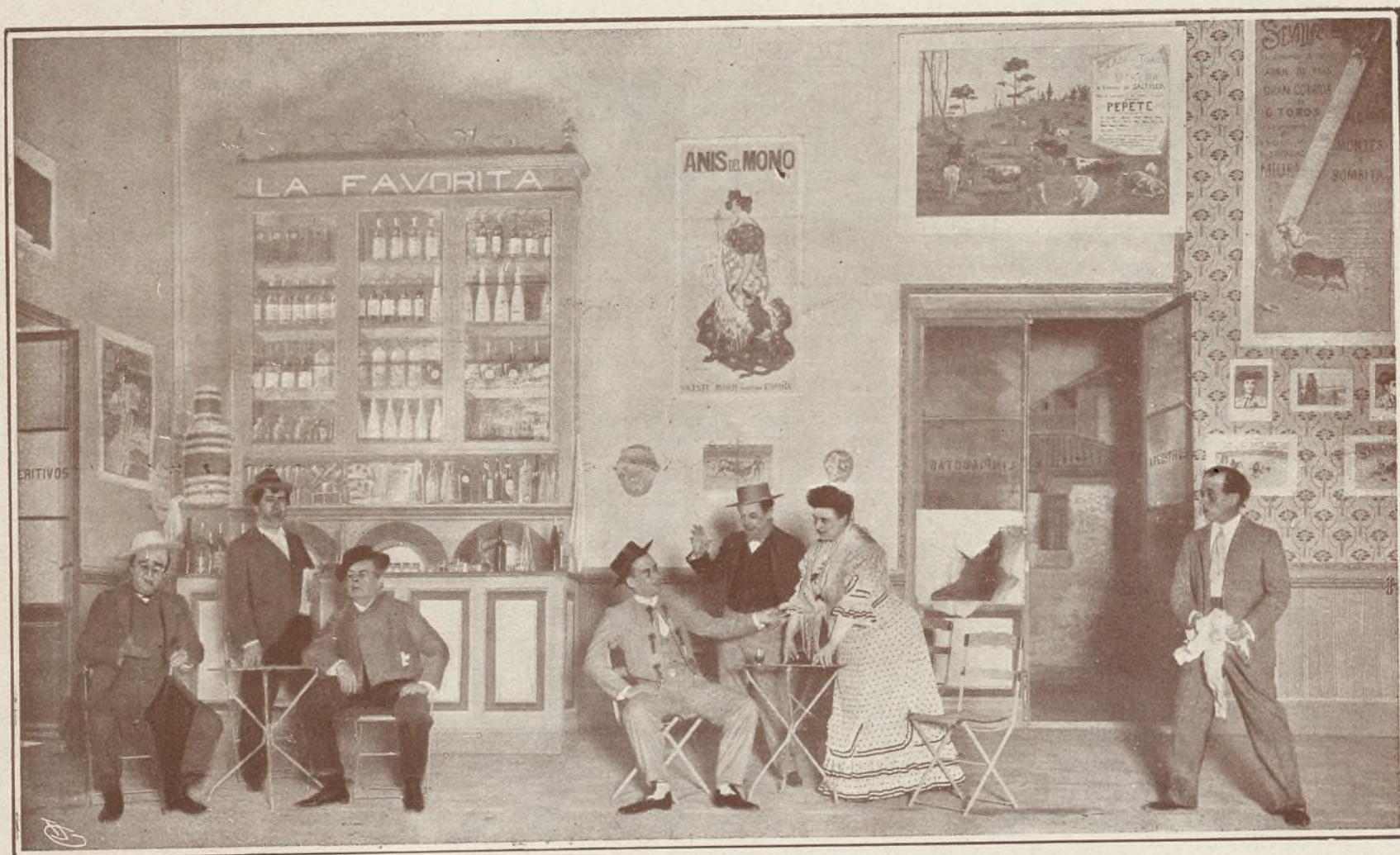
LA MALA SOMBRA

Debemos ocuparnos ahora de la Comedia, que abrió sus puertas con una novedad teatral. Es ésta la obra de Rostand titulada Les romanesques , y traducida al castellano con el título de Los noveleros . Les romanesques fué la primer comedia que proporcionó un éxito á Rostand, y que hizo conocer su nombre, el cual había de ser después tan universal por el Cyrano .