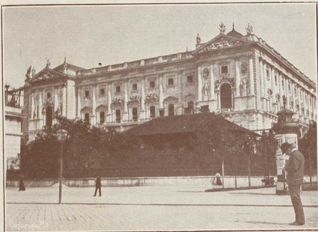
Nuevo palacio del Emperador.

cisco I, esposo de María Teresa. Hay en el jardín hermosos invernaderos, en los que se cultivan con gran esmero las plantas y las flores más delicadas.