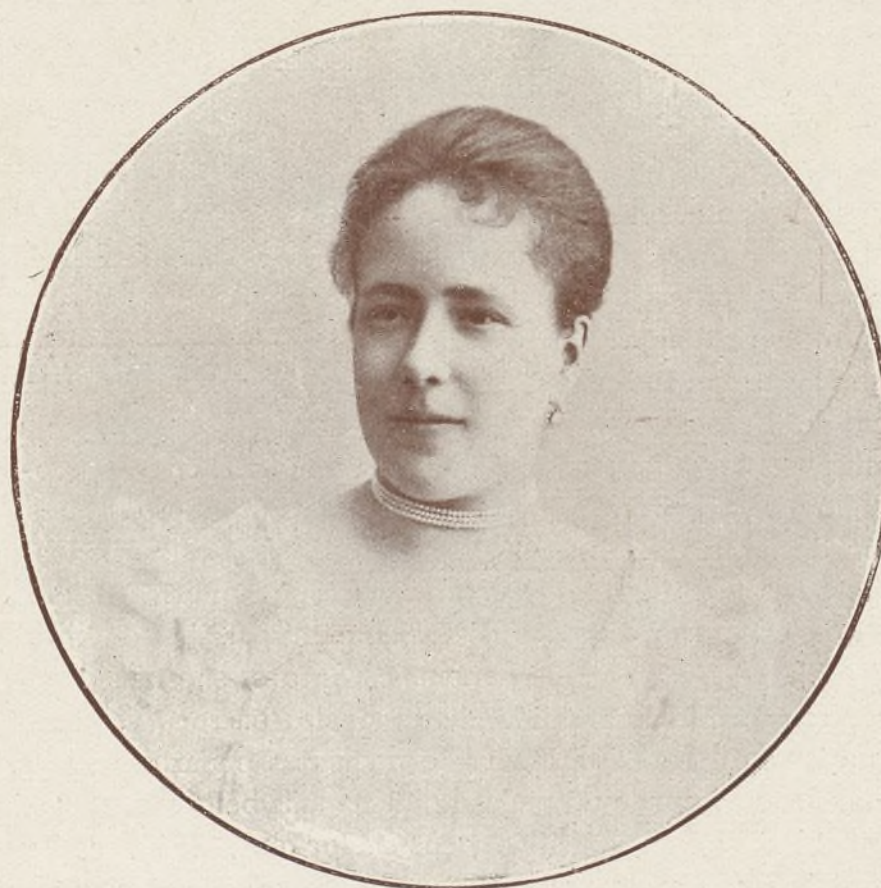
Archiduquesa María Cristina.