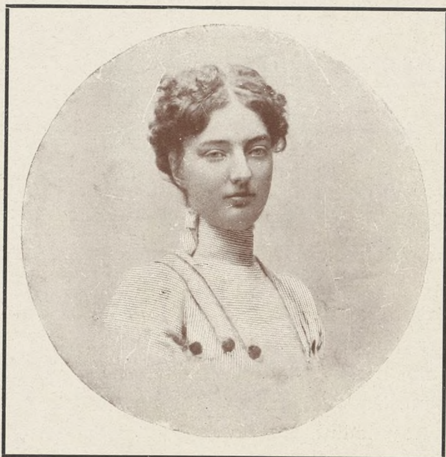
Princesa María Luisa de Orleans.

P UEDE decirse que el invierno ha llegado, sin haber pasado, como debiera, por las puertas del otoño. Aún no se han desprendido las hojas de oro de los árboles. Aún no ha regresado todo el mundo á Madrid, y el frío ha hecho lucir antes que de costumbre los abrigos.