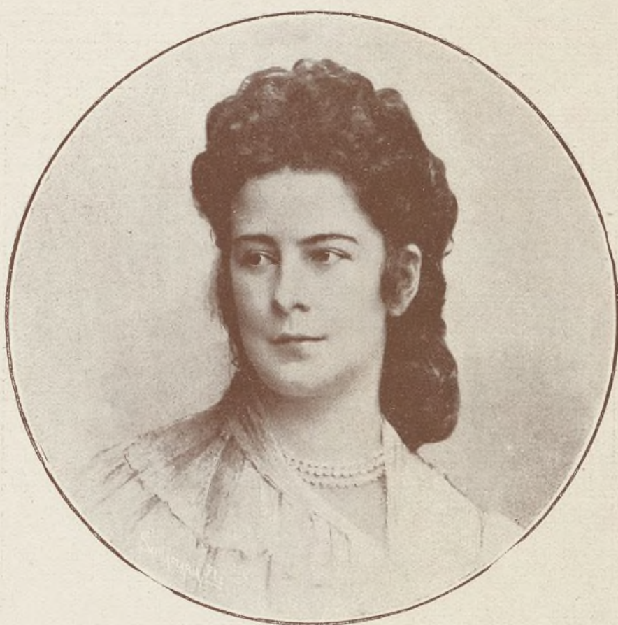
Princesa Isabel de Baviera.

Fuentes ú otros monumentos adornan casi todas las plazas; en la de Hof, que es la mayor y más regular, se levantan una colosal estatua de la virgen y dos hermosas fuentes con figuras alegóricas de bronce; en la plaza de José hay la estatua ecuestre, también de bronce, de José II; en la de Neue-Markt se ve una fuente cuyas figuras de plomo representan los cuatro ríos principales del Austria Inferior; dos bellas fuentes adornan la de Hohe-Markt; en Bug-Platz se eleva el Palacio Imperial, y en la más concurrida de todas, la de Graben, situada en el centro de la ciudad y que más que plaza parece una calle ancha, existe el soberbio monumento de mármol consagrado á la Santísima Trinidad en memoria de la peste que afligió una vez á Viena, y dos estatuas de plomo. Esta plaza y el Kohl-Markt, hermosa y espaciosa calle que á ella conduce, son el