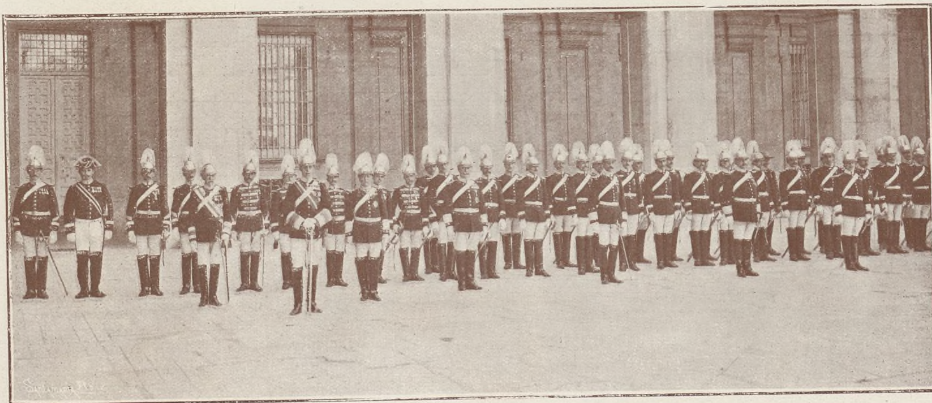
S. M. el Rey D. Alfonso XIII al frente de la Escolta Real.