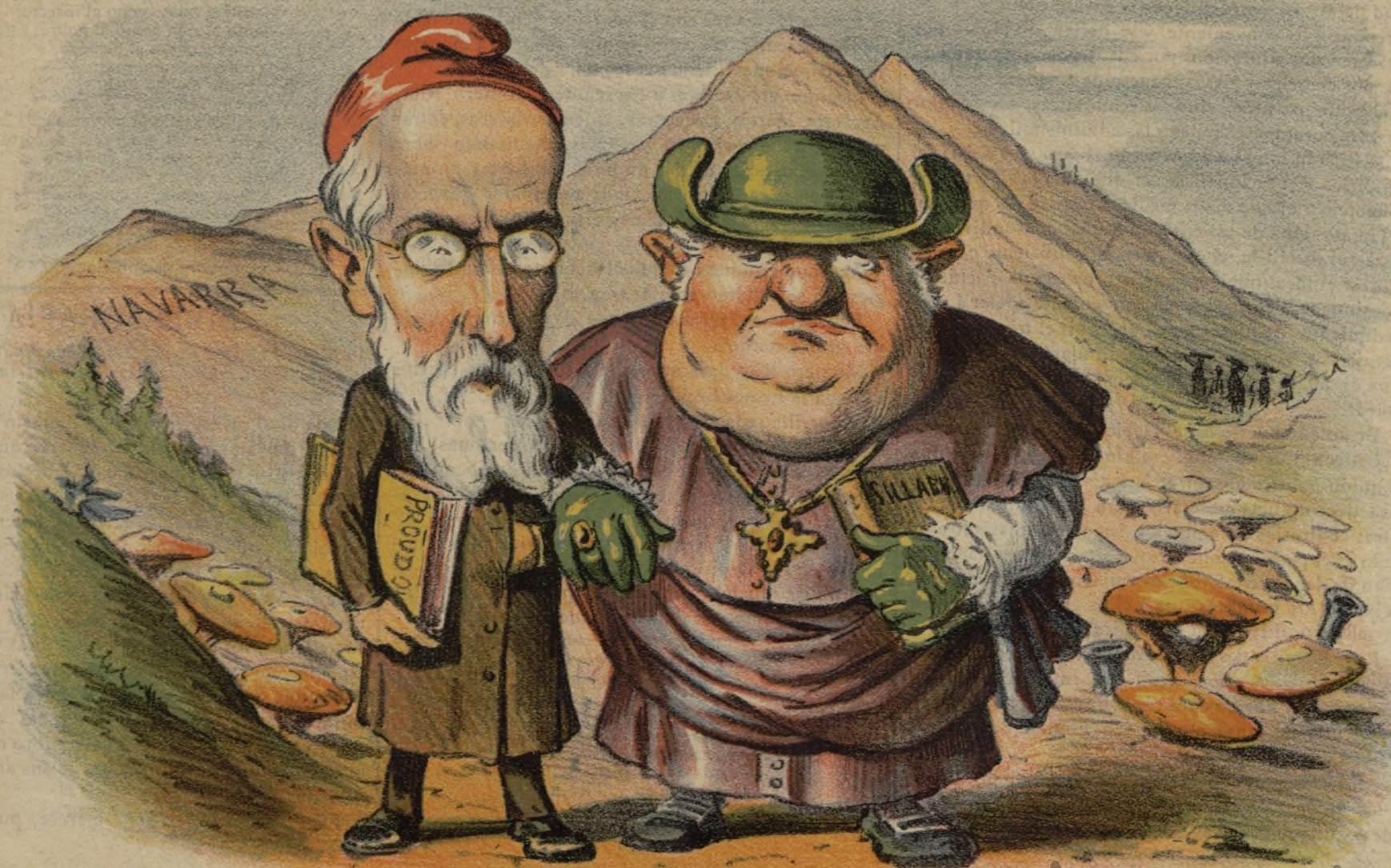
DIOS LOS CRIA Y ELLOS SE JUNTAN.