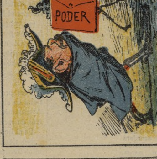
27. Del Poder sigue la pista y se mete á fusiónista.