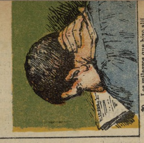
30. Los milagros que hizo allí... que me los plañen aquí.