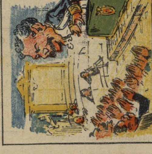
22. En las Cortes, al hablar quiso se aplaudió por compromiso.