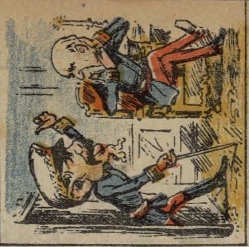
10. Más Turon, gran militar no lo quiere proclamar.