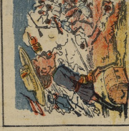
16. En Cuba pone en vigor su sistema vencedor.