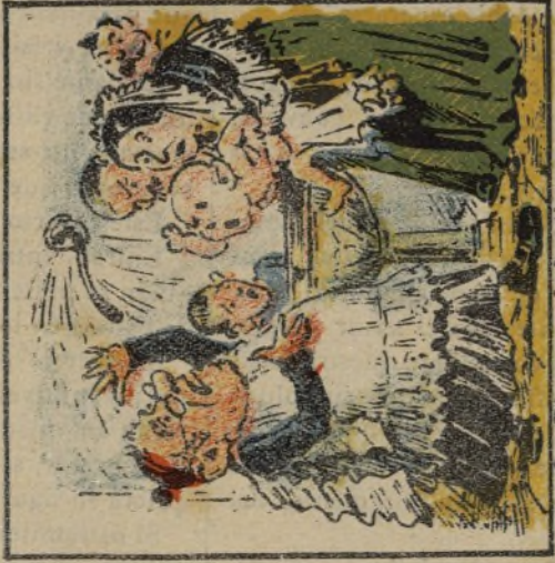
2. Dicen que lo bautizaron, más no sé si lo lograron.