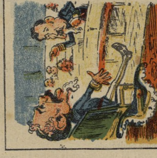
21. Salamanca en el Congreso me lo deja petitiiso.