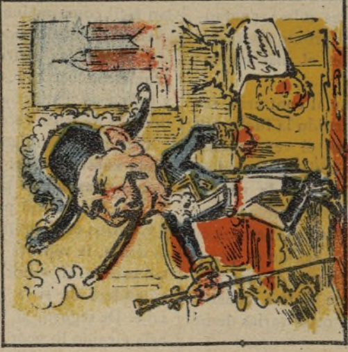
7. Como general ya empuja el mando de Cataluña.