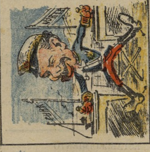
17. Hace en el Norte y la Habana lo que á él le dá la gana.