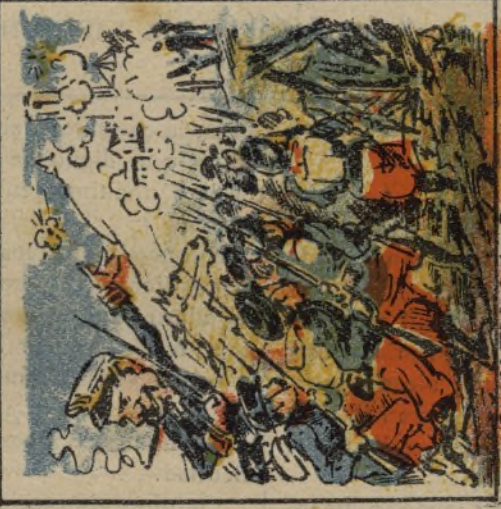
8. Al Xich de las Barraquetas arrelló con bayonetas.