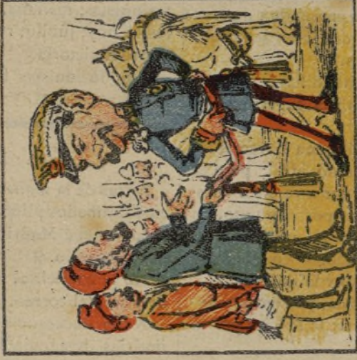
6. Le debe á la federal el fujin de general.