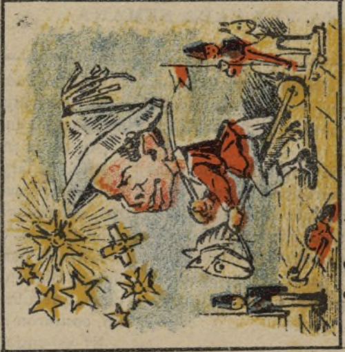
3. Sus primeras impresiones son estrellas y galones.