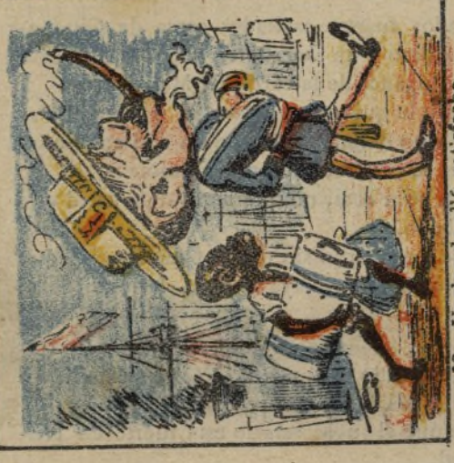
18. Vuelve de allá, satisfecho... y Dios sabe lo que ha hecho.