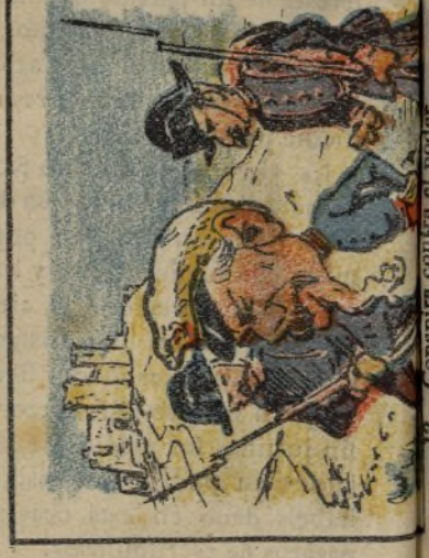
12. Conspira contra el poder y lo encierran en Belver.