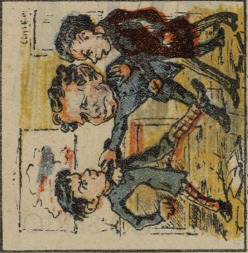
4. Si alguna rifa se armaba luego la pacificaba.