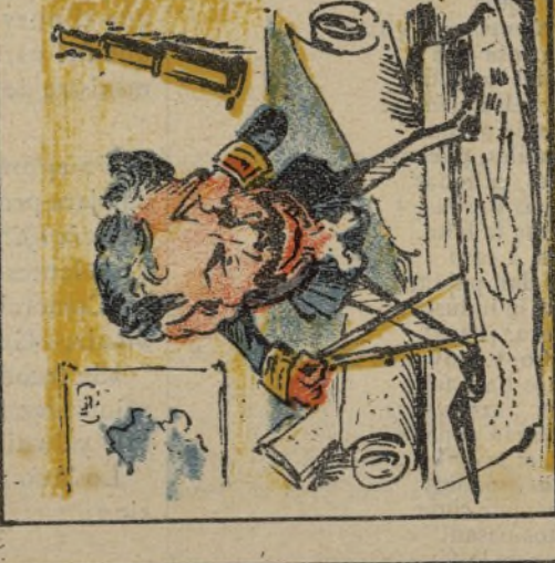
28. Distrajendo sus pesares forma planes militares.