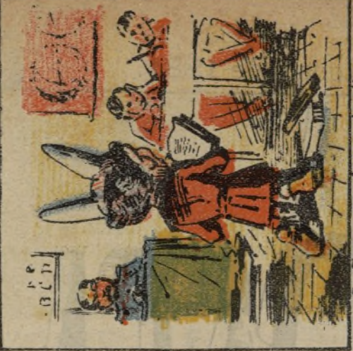
5. Como profesor inclina a cumplir la disciplina.