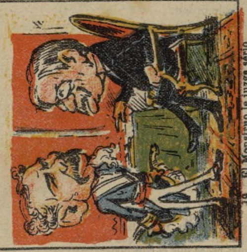
19. El Monstruo le juzga serio para formar Ministerio.