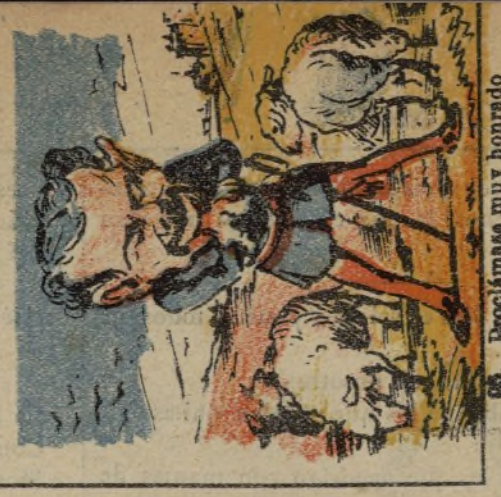
25. Proclámanse muy honrado y por eso le han volcado.