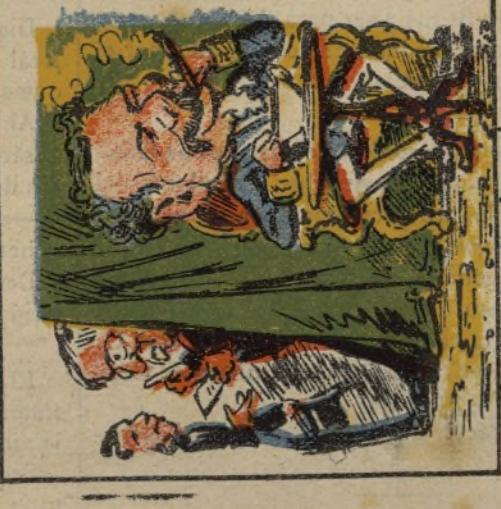
23. Cánovas tras la corvina las elecciones combina.