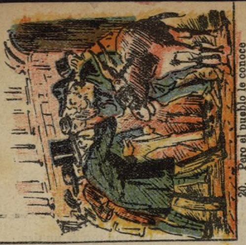
20. Pero el pueblo le conoce y murmura sotto-voce.