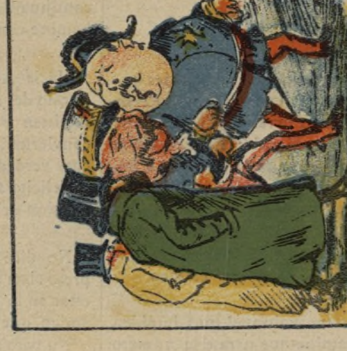
26. Va con malas compañías pero solo cuatro días.