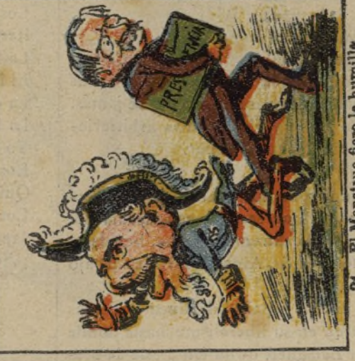
24. El Monstruo fiero le humille y le hecha la zancadilla.