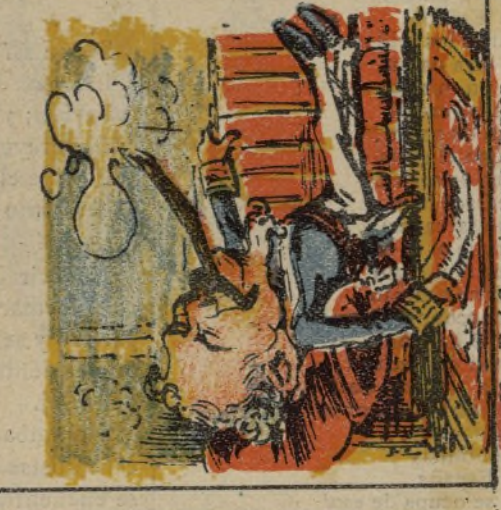
29. Fue Sagasta aguas tomar y le dejó en su lugar.