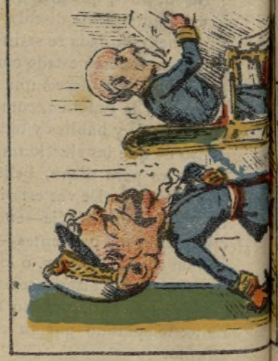
11. Se las echa muy formal de hombre serio y liberal.