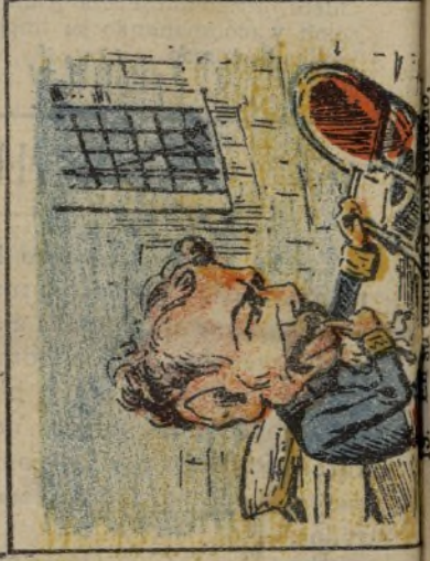
13. piensa restaurar un trono.