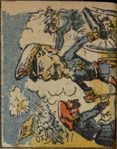
15. triunfo de la Rebelión.