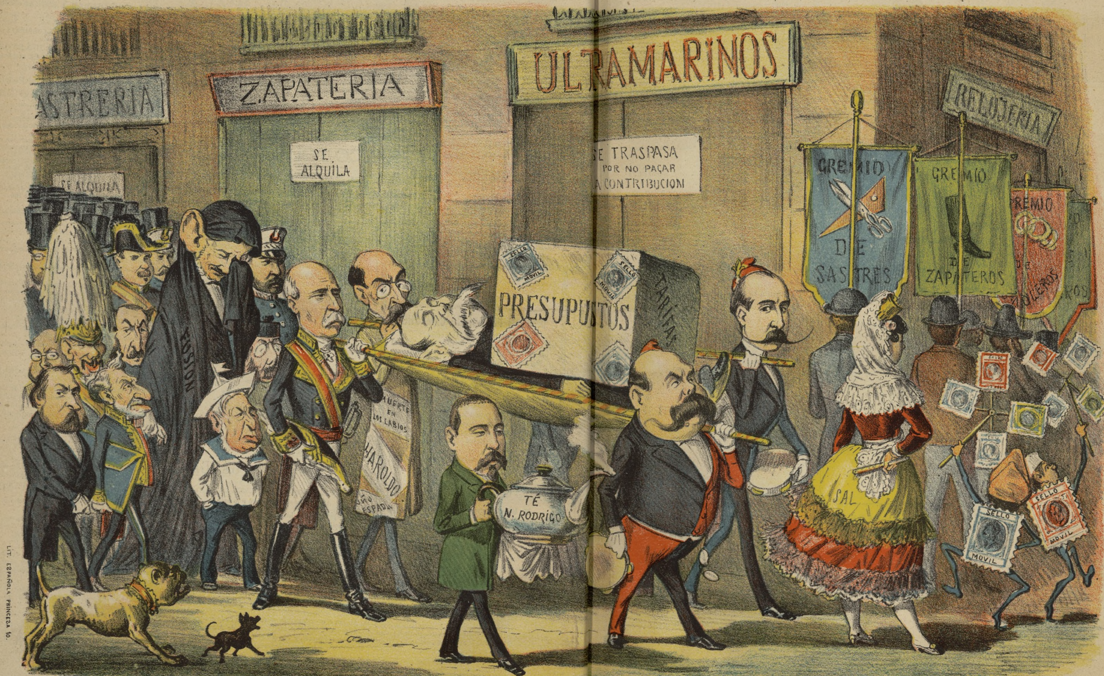
El entierro de la salina fusionista. Ayuntamiento de Madrid