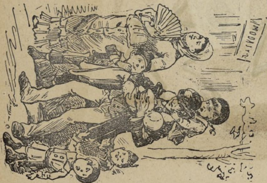
Capítulo VII — La felicidad en el matrimonio.

IMPRENTA LA RENAIKENSE, XUCLÁ, 13, BAJOS.