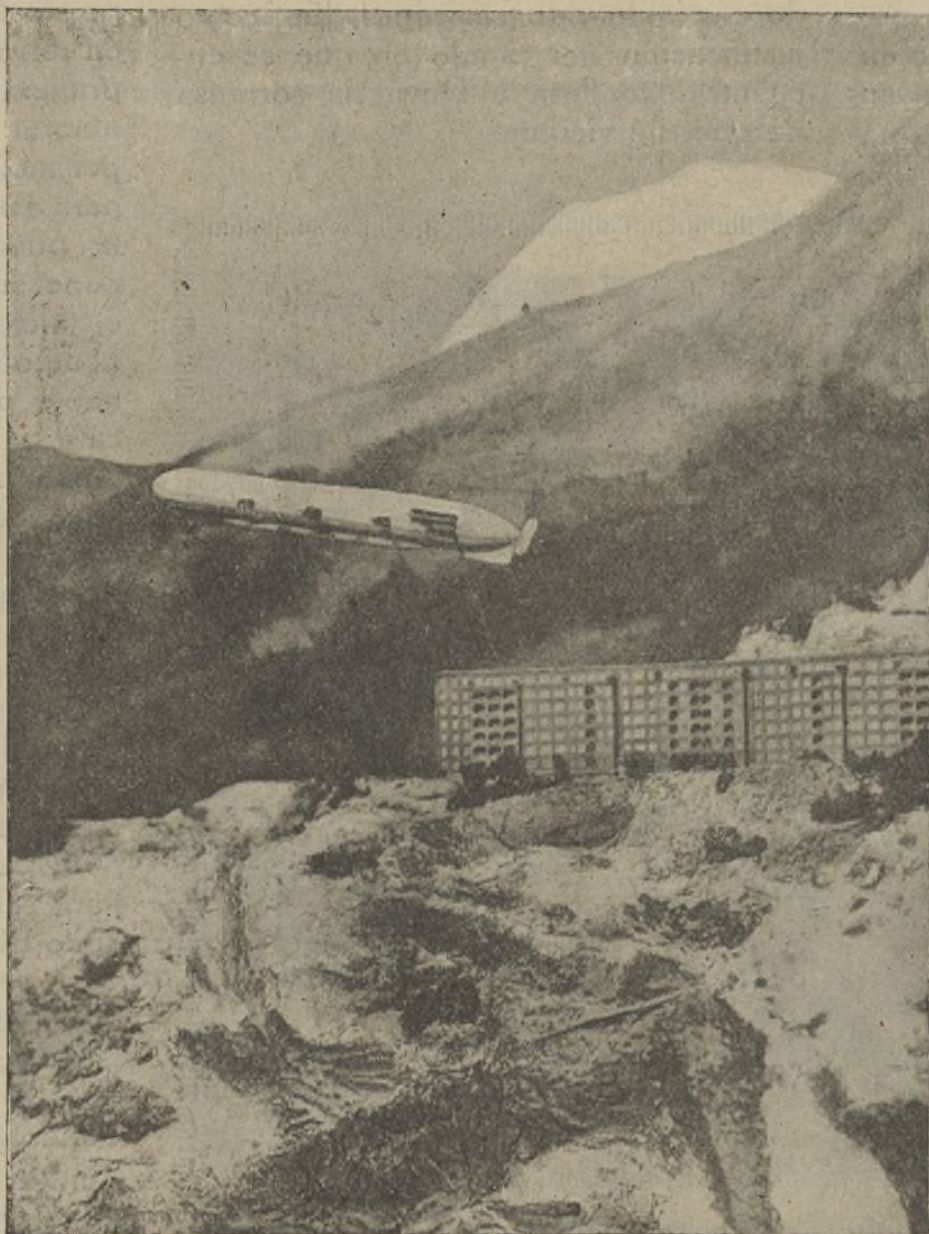
Una escena de la película «Los piratas aéreos»

reposo, pretendiendo liquidar con él delitos cometidos por los demás y que Harry tenía el prurito de no consentir jamás que fuesen discutidos ni puestos en evidencia en el banquillo de los acusados.