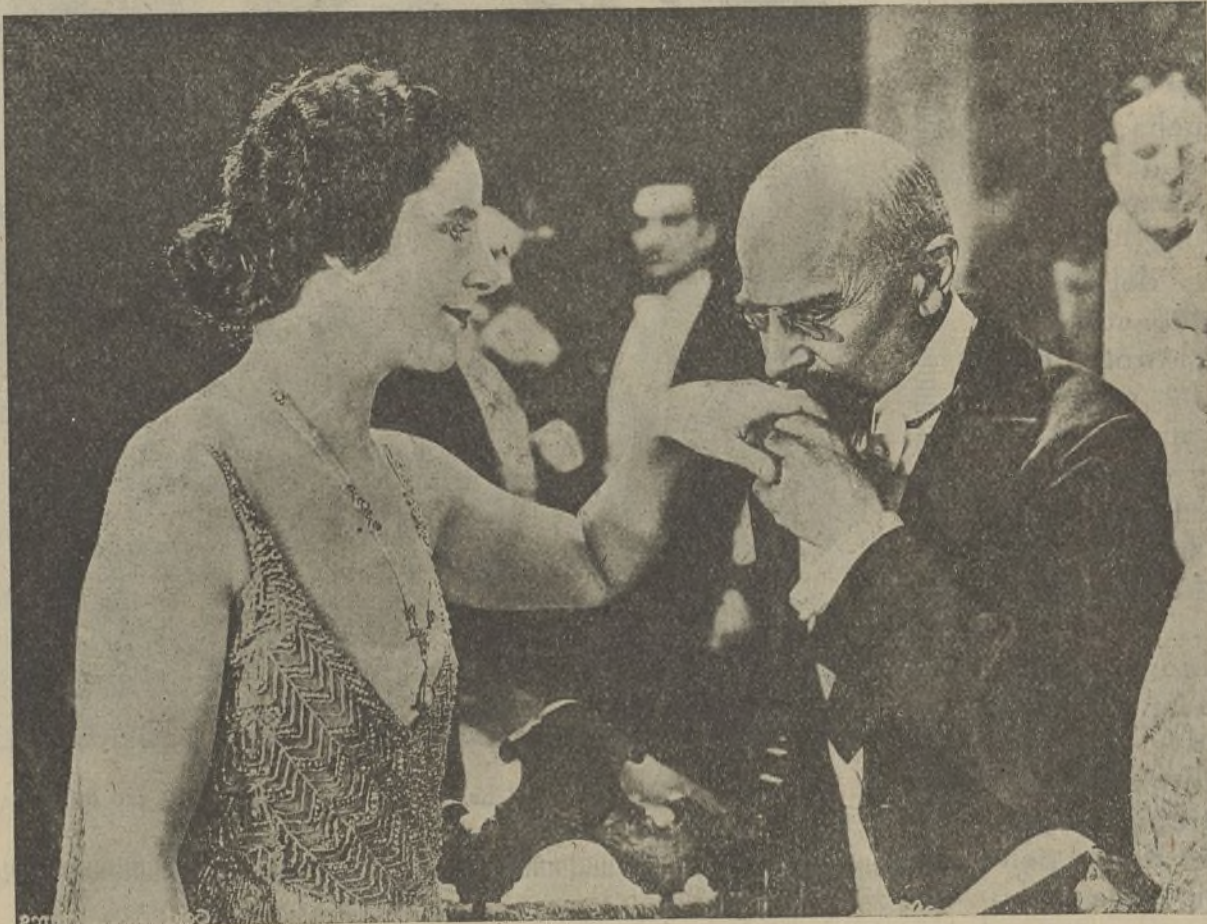
Una escena de la película «Giro de la rueda»

ke. Una noche, apenas Elena se había entrado en su camarote llena de encanto el alma por las frases amorosas de Tom, que al fin había dejado hablar a sus sentimientos, recibió la visita de «El Lobo», que la maniató, la amordazó y le robó el mapa; pero la presencia inesperada de «El Rostro Invisible» le sorprendió de tal modo, que se dejó arrebatar el mapa ante la mortal amenaza del enmascarado, el cual sacó a Elena del camarote y, amordazada como estaba, la arrojó al mar, dejándola indefensa a merced de las olas.