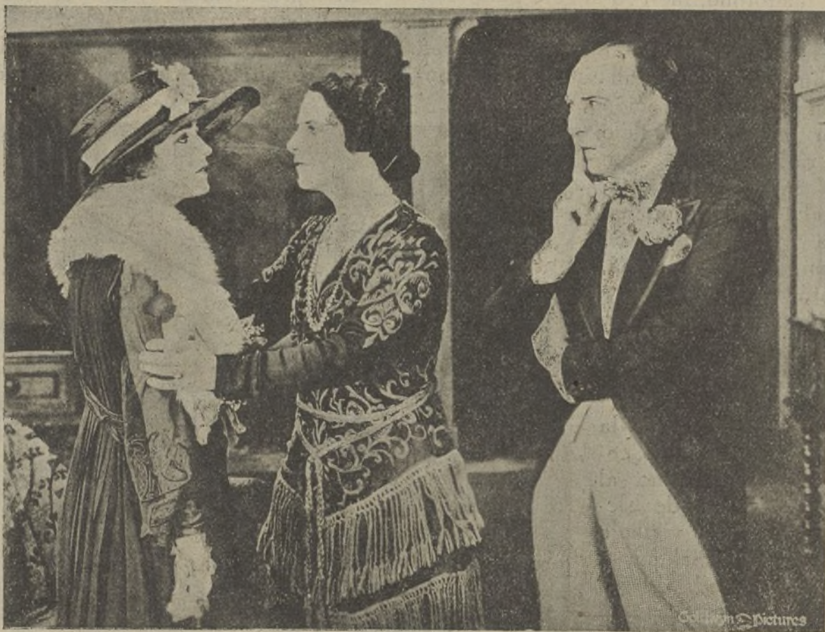
Una escena de la película «Giro de la rueda»

Y una semana más tarde, Elena y Tom, en compañía de «La Urraca», bogaban hacia el hogar tranquilo, sin ambiciones ni luchas, donde tendría un trono eterno, la alegría del amor.