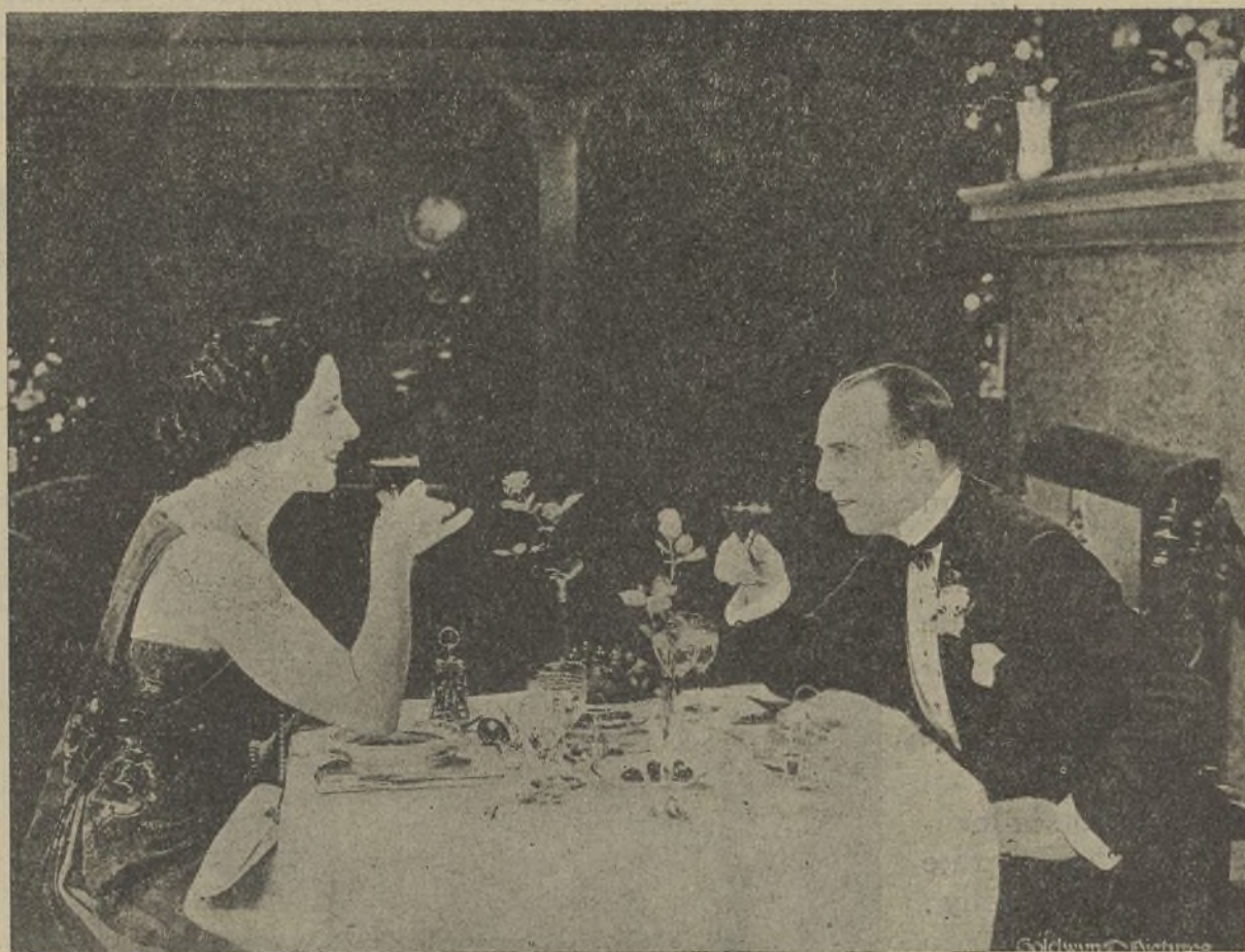
Una escena de la película «Giro de la rueda»

él: el «13», nombre de la siniestra asociación, y el «6», número del asesino de su hermano Jaime. Libre por un momento de su irreductible rival, corrió Hugo al piso superior, donde aún su pupila Rosa se defendía bravamente de los ataques de Rafael Greer, y la libró del monstruo de lascivia, en tanto que Ferron arrancaba el plano de manos de Mariana; pero no mucho después, una sorpresa de los enmascara-