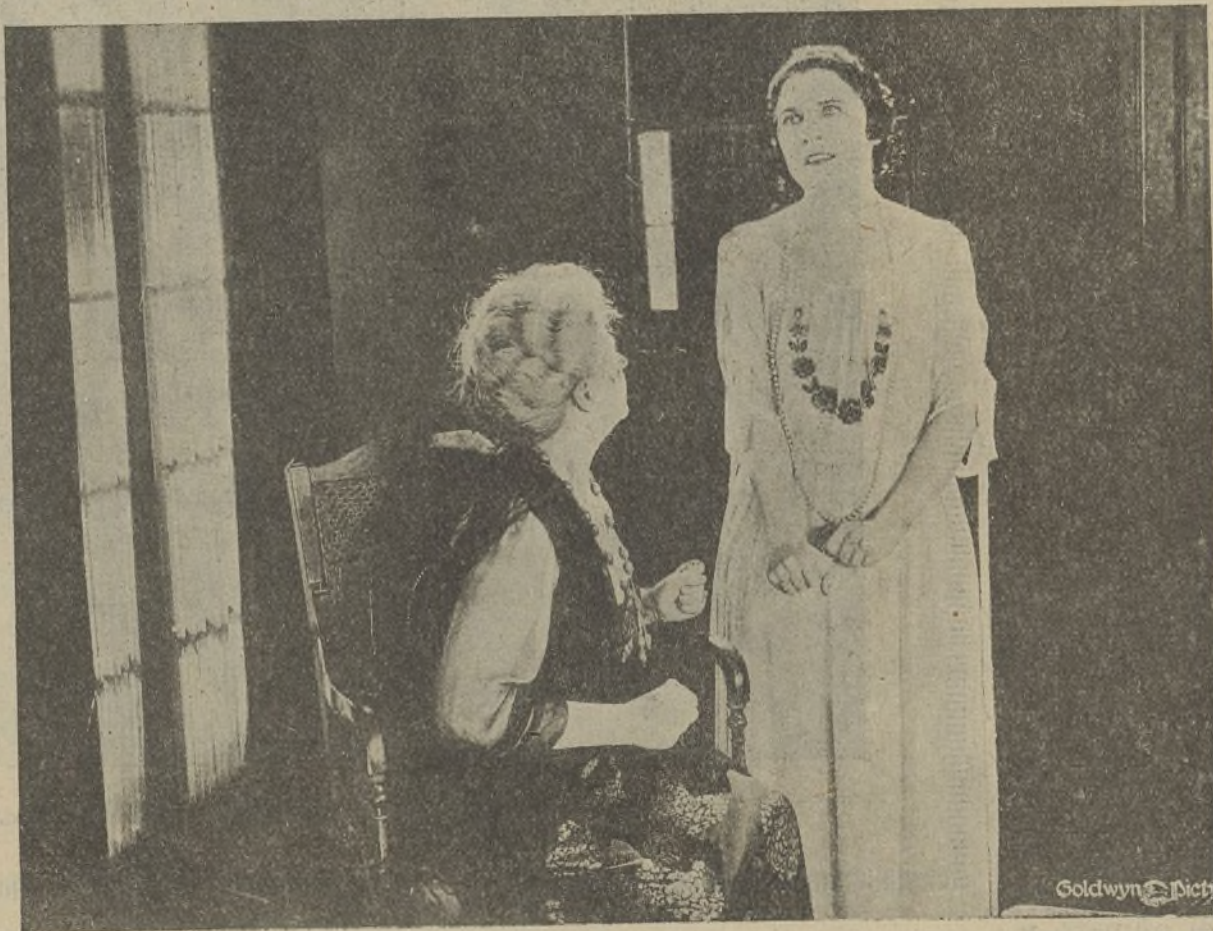
Una escena de la película «Giro de la rueda»

Hugo, figura preeminente en los círculos de la alta sociedad de Nueva York. Hugo sospecha que Juan Greer, no obstante su aparente respetabilidad social, tiene concomitancias con la secta misteriosa, y le conmina con un castigo severo si se prueba su participación en el asesinato de su hermano. Sin embargo, Jaime vive y se acerca a Hugo, escondido en un barco que navega hacia el norte. Descubierto por un marinero,