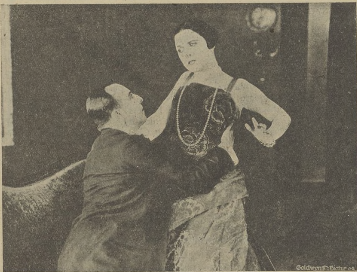
Una escena de la película «Giro de la rueda»

Agua y fuego. — «Los Trece» golpearon, hasta derribarla, la puerta del subterráneo en que Hugo se había re-