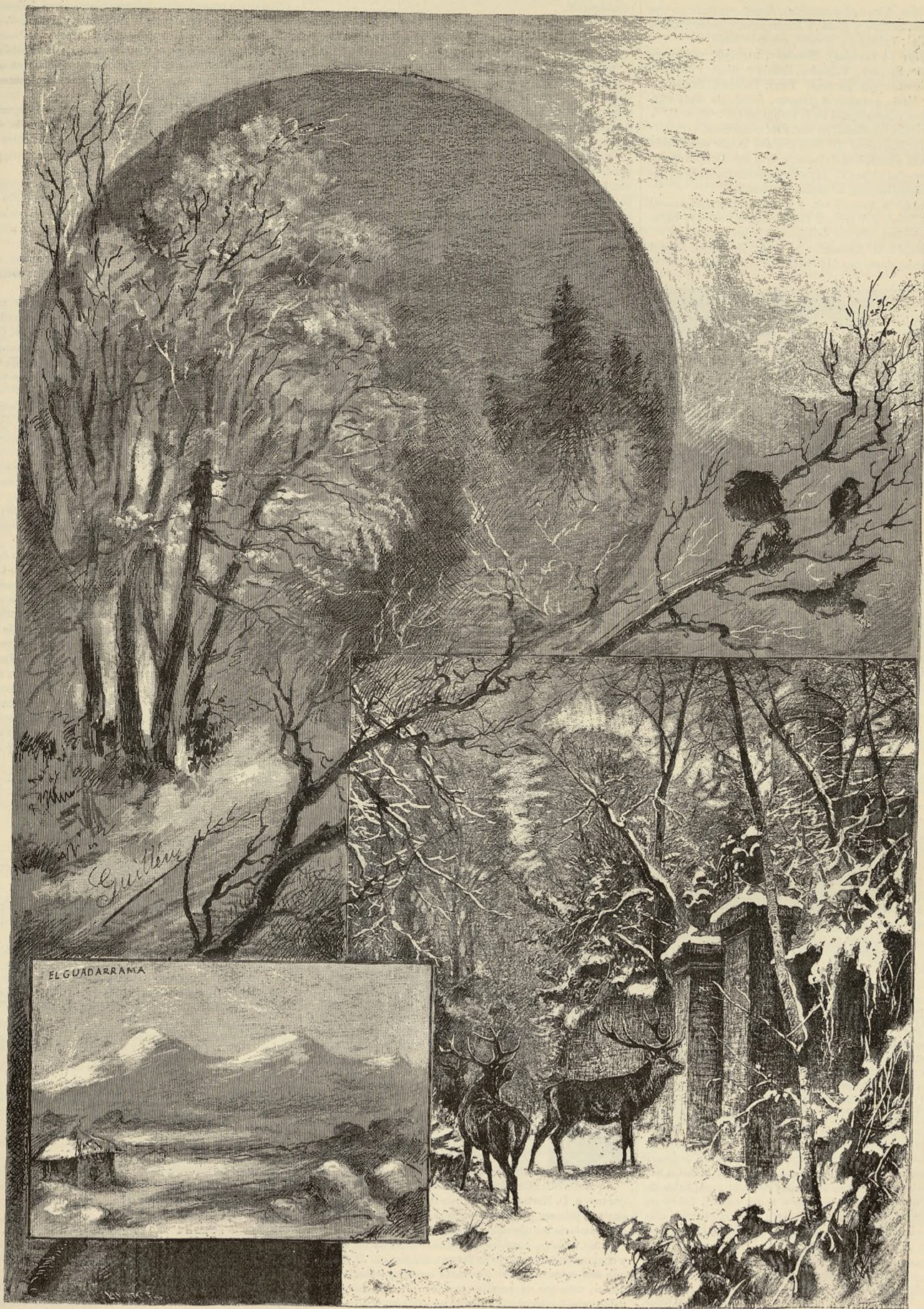
DÍAS DE INVIERNO.—COMPOSICIÓN Y DIBUJO DE GUILLÉN.