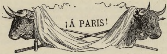
La Gran plaza de la Pergolesse.

¿No es cierto que resulta curioso esto de fijar entre cuernos el nombre de la encantadora capital de Europa?