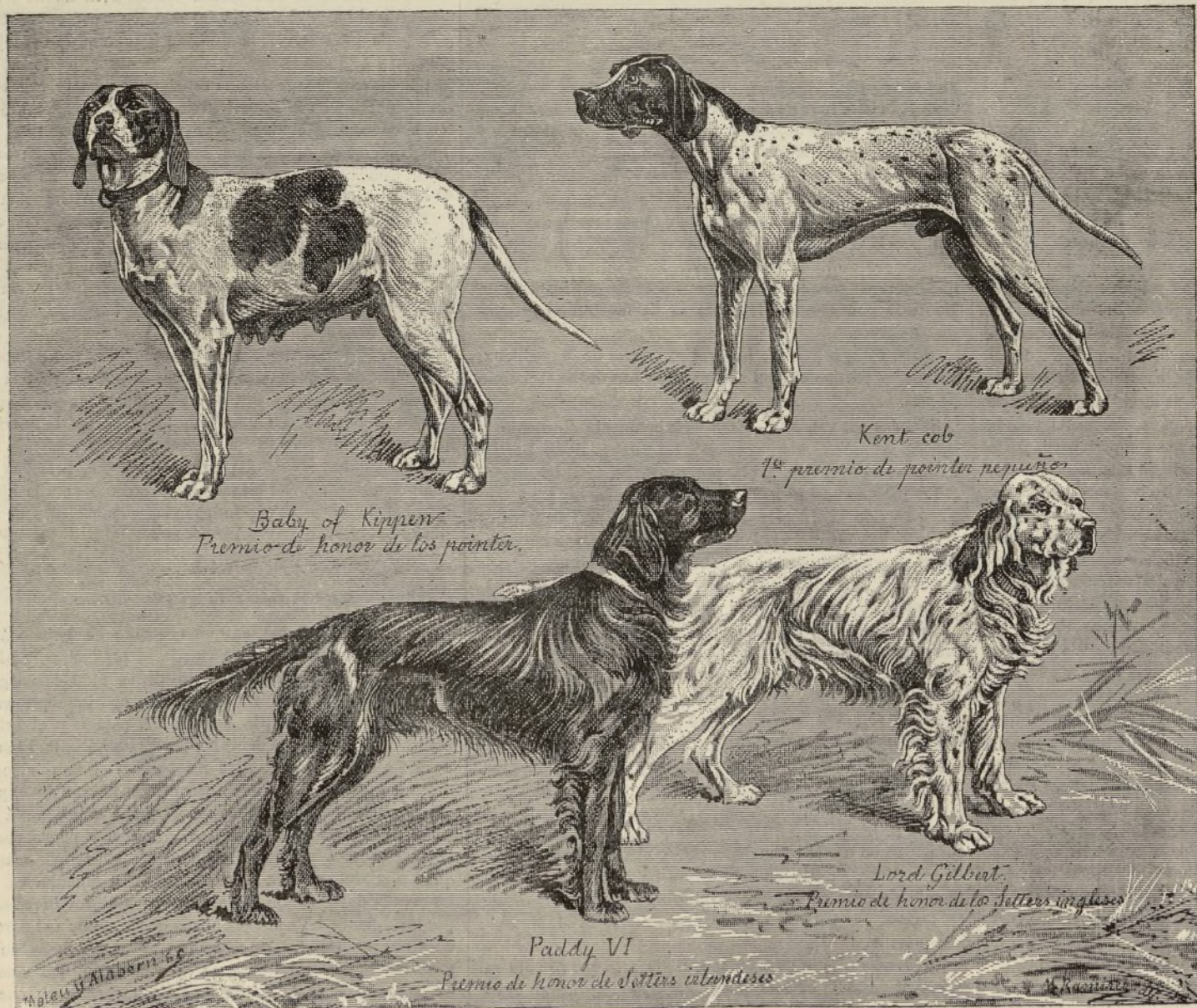
EJEMPLARES PREMIADOS EN LA EXPOSICIÓN CANINA DE PARÍS. (Dibujo tomado de La Chasse Illustrée .)

En la de perros de gran talla, Joung Goth , de M. Paul Gallet, y Boum , de M. Godebert, que son dos buenos perros, han ganado el primero y segundo premio. Joung Goth sería absolutamente notable si tuviera el cuello un poco más largo y la cabeza mejor modelada, pues en todo lo demás está hecho a molde. Shylock , de M. Delavanit, ha obtenido una mención muy honorífica.