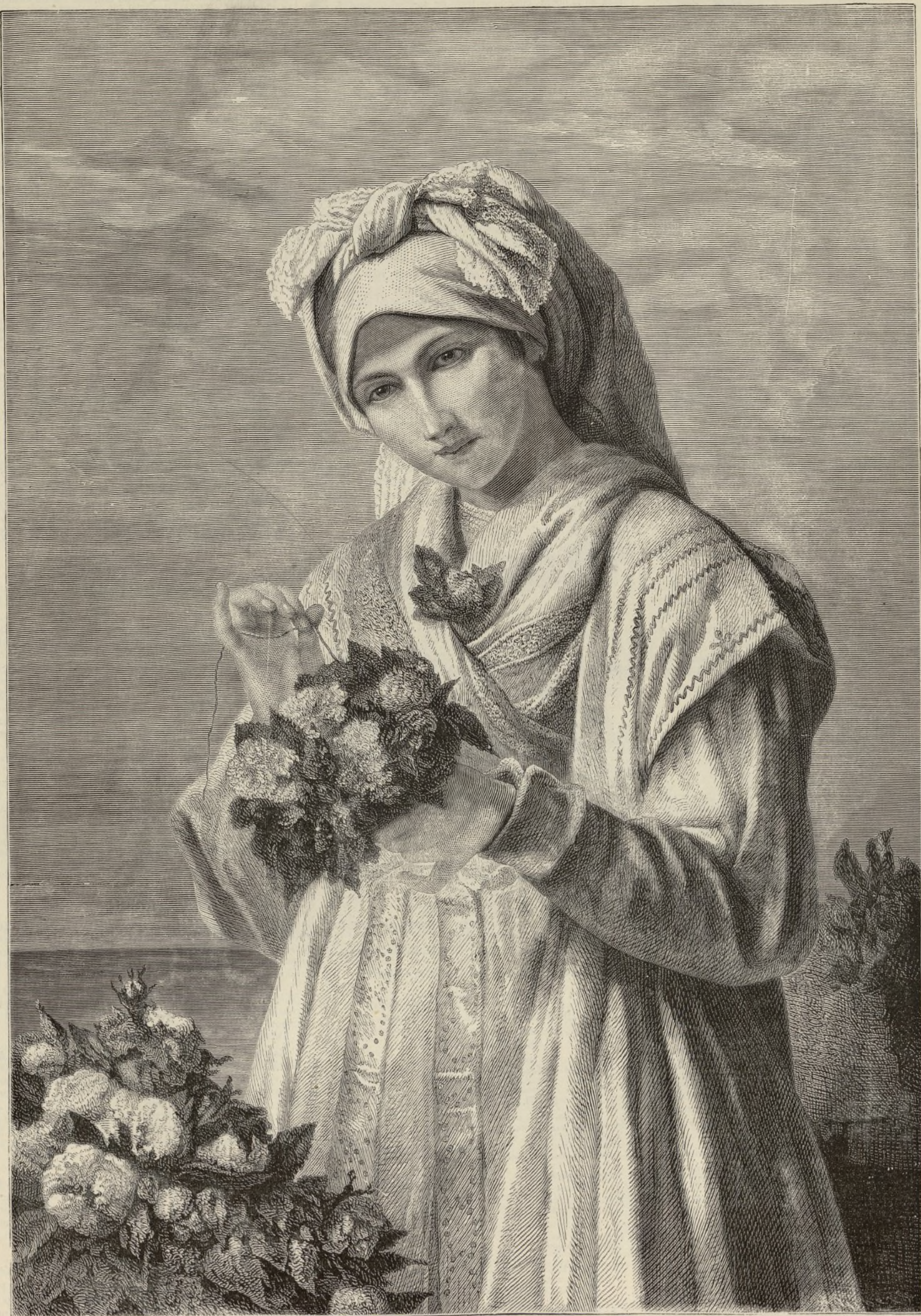
LA FLORISTA DE TRIESTE.