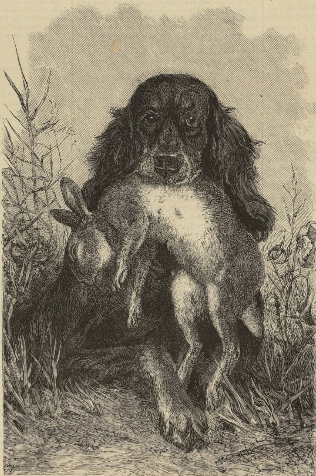
EL ÚLTIMO ESFUERZO.

La Epoca había iniciado el pensamiento de celebrar una Exposición nacional de aceites, en forma parecida á la brillante Exposición de vinos que se celebró en Madrid hace algunos años; pero el Sr. Director de Agricultura, aceptando este pensamiento, y proclamando la oportuna iniciativa del periódico conservador, creyó con buen sentido que no había razones suficientes para circunscribir el certamen á una sola rama de la riqueza