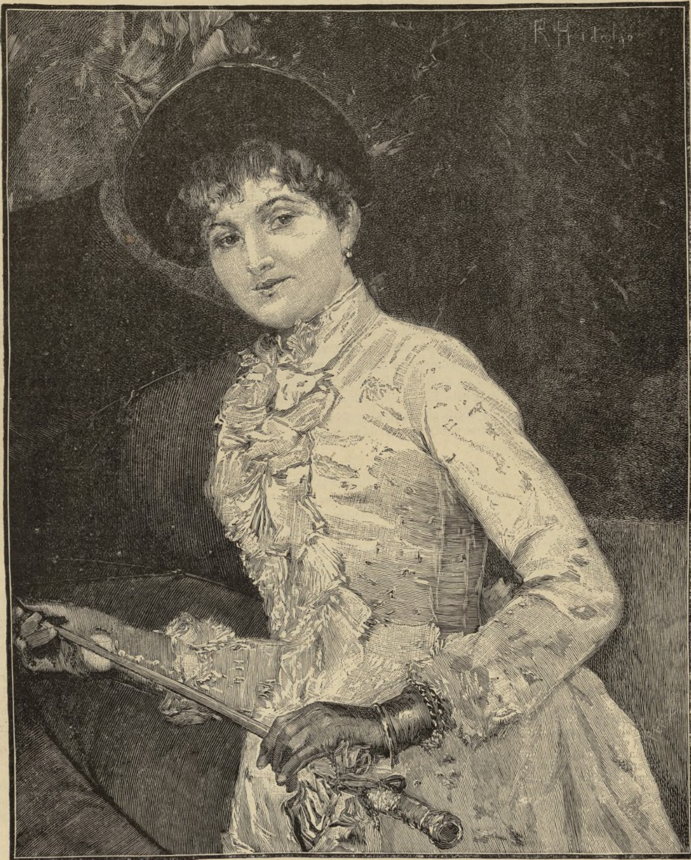
PARISIENSE.—CUADRO DE FÉLIX R. HIDALGO (DE FOTOGRAFÍA).

»Pero Massini no fué oído en todo el día ni se movió del rincón. Pasamos la noche velando su intranquilo sueño, y al amanecer del siguiente día, cuando las convulsiones que daba hacían renacer en nosotras la confianza.... espiró, llenando de amargura nuestras almas.