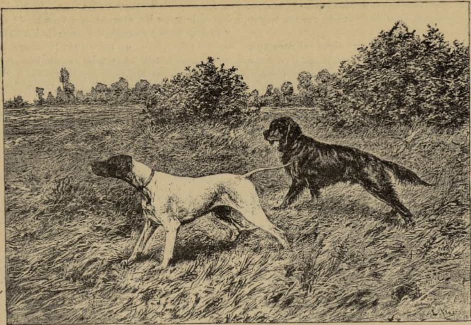
BOY, POINTER, Y DUKE OF DEVONSHIRE, SETTER GORDON. Primeros premios en los dos concursos de Chatenay.