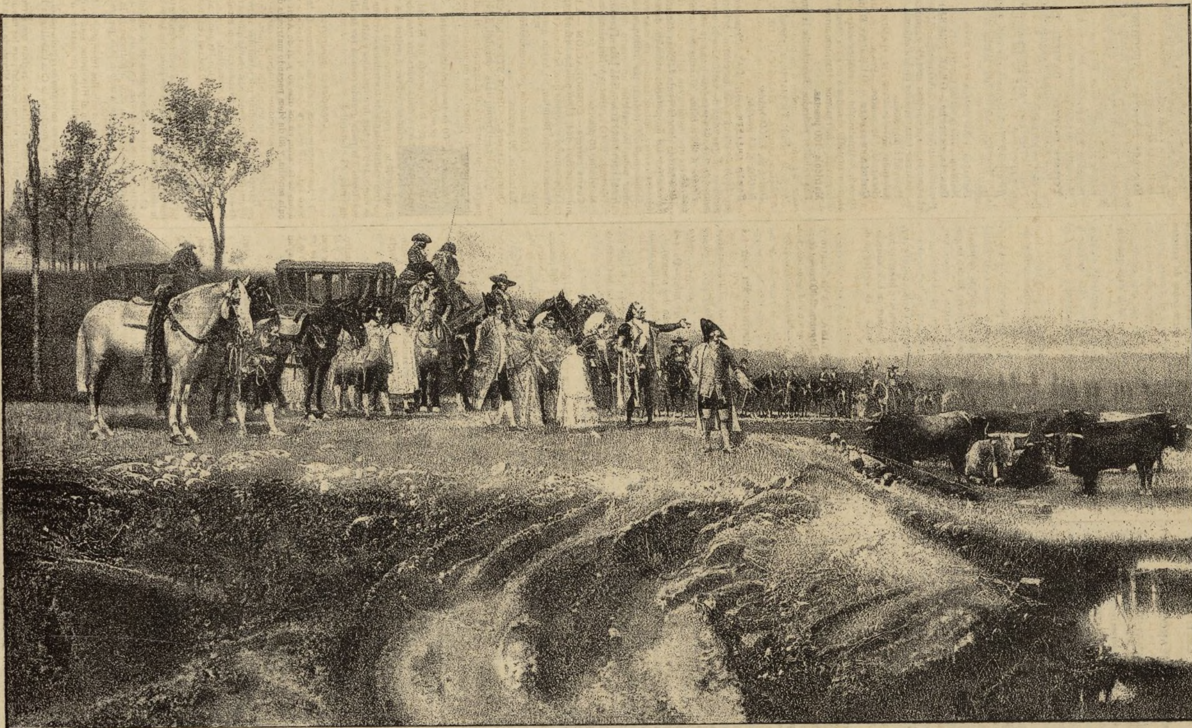
PEDRO ROMERO SEPARANDO LOS TOROS DE UNA CORRIDA.

(Composición y dibujo de D. Marcelino de Unceta.)