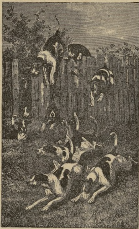
JAURÍA DE FOXHOUNDS.