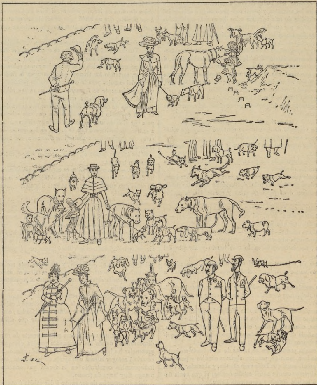
REGRESO DE UNA EXPOSICIÓN CANINA, POR GRAFTY.