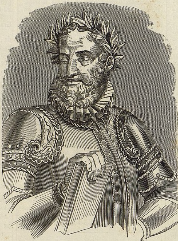
LUIS DE CAMOENS.