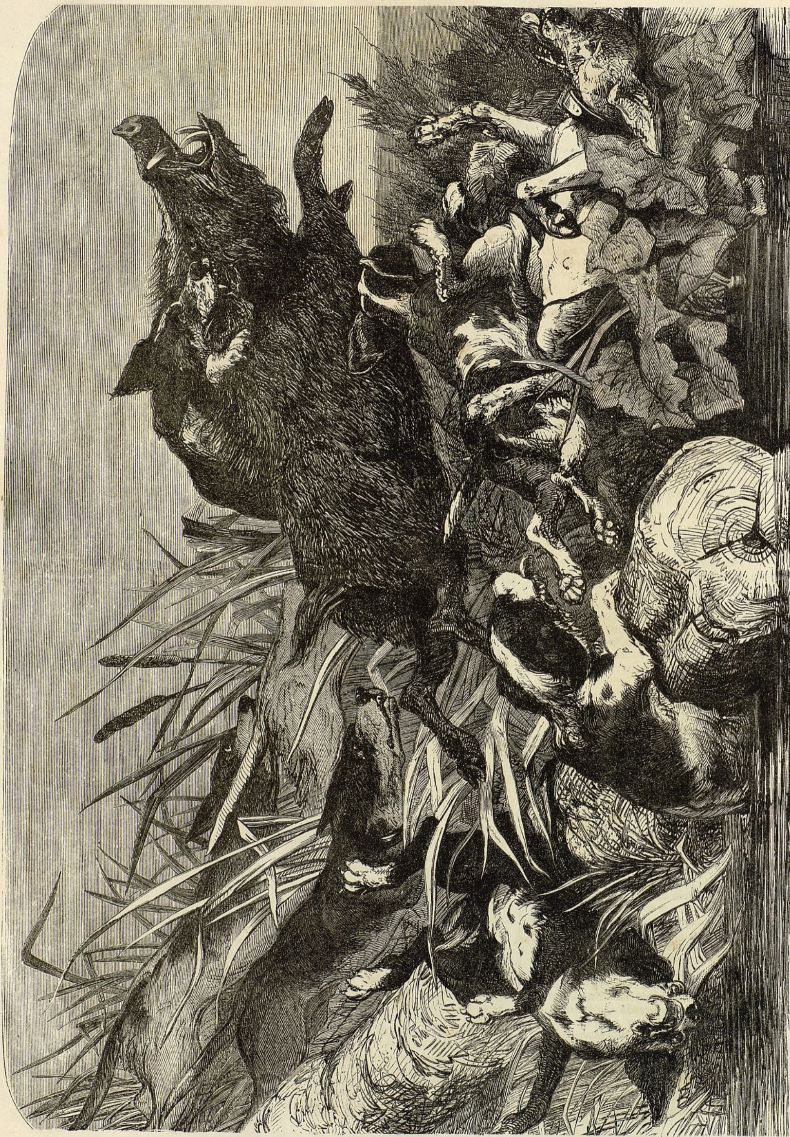
LA CAZA DEL JABALÍ.