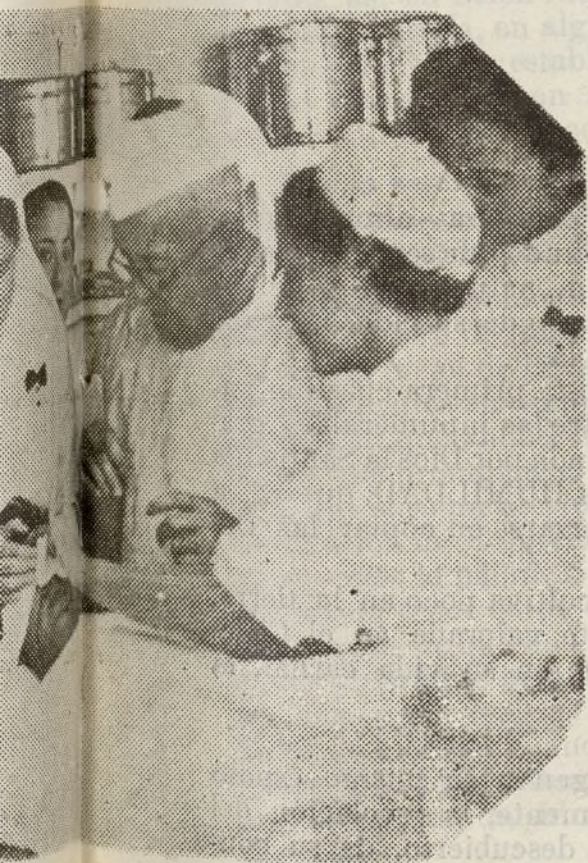
a infanta doña Mercedes de y Borbón, enfermera de la Roja en Zaragoza, asiste a cura efectuado por doctor ligo a un herido de guerra.

Yo prosigo y le digo que el cruel bombardeo fué el milagro caliente que estalló en un deseo popular y grandioso: él nos hizo vencer; al contarle que el pueblo como un río crecía, la elegante Infantina otra vez se reía con la blanca sonrisa de un capullo al romper.