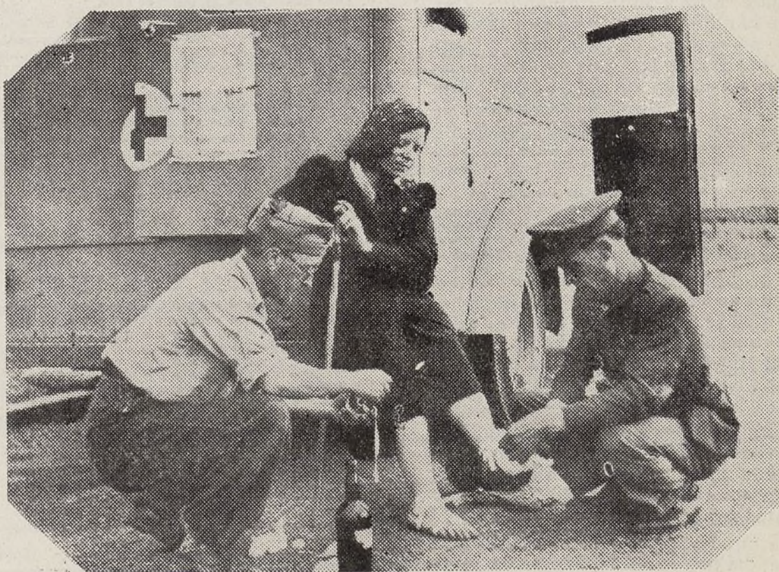
Los pies de esta peregrina descalza se han llagado en la marcha y los servicios de la Cruz Roja la curan y vendan para que pueda seguir su camino al Pilar

odisea de su persecución por las hordas marxistas, impregnadas sus almas por el bálsamo de su inquebrantable fe y patriotismo, recorrieron los trescientos veintidós kilómetros en doce etapas que separa Madrid del Santo Pilar de Zaragoza, soportando las in