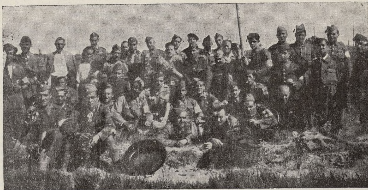
El personal de estas Ambulancias en el descanso de los ejercicios practicados durante su excursión a Juslibol

Una suscripción fué pagada con el dinero de un grupo que había ganado el concurso del más hermoso álbum de correspondencia interescolar.