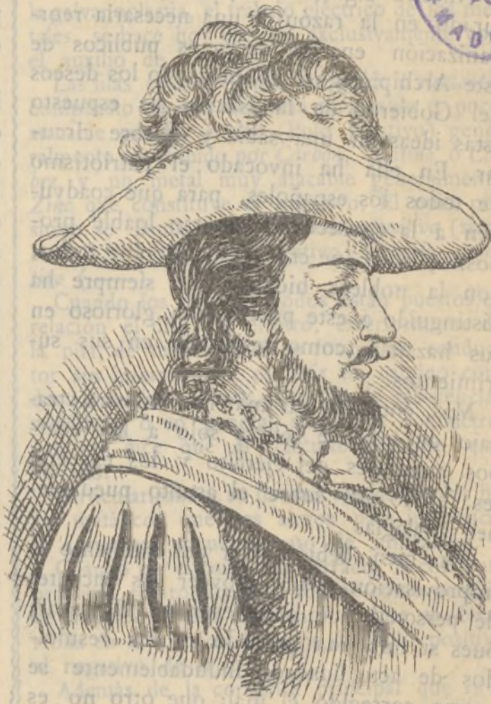
MIGUEL LÓPEZ DE LEGASPI