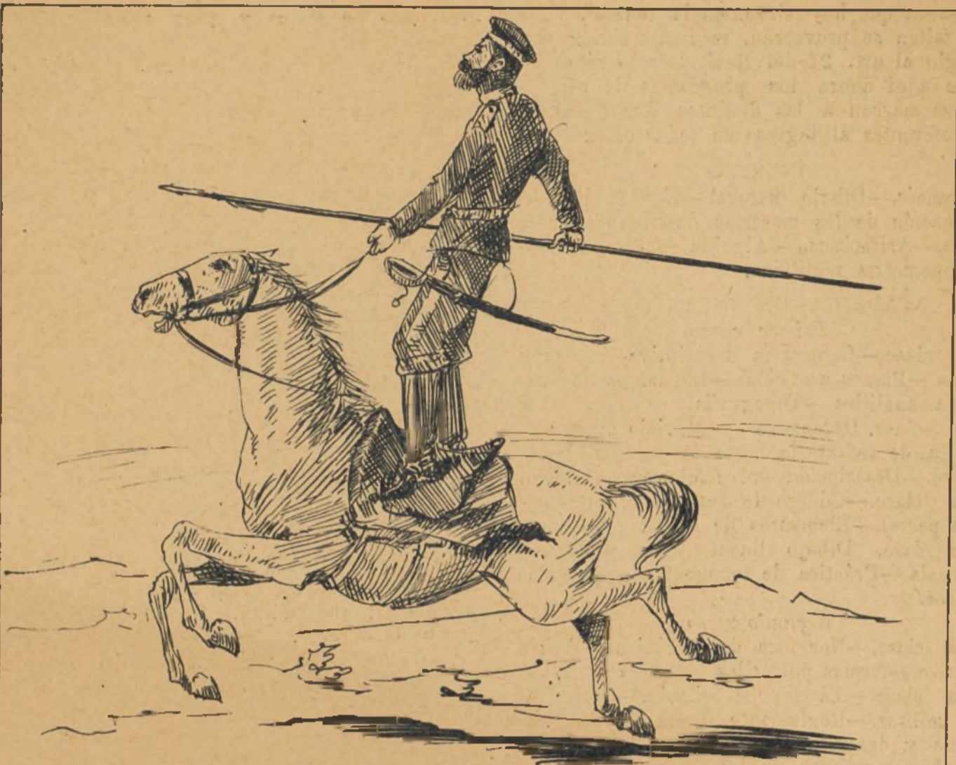
Explorando el terreno.