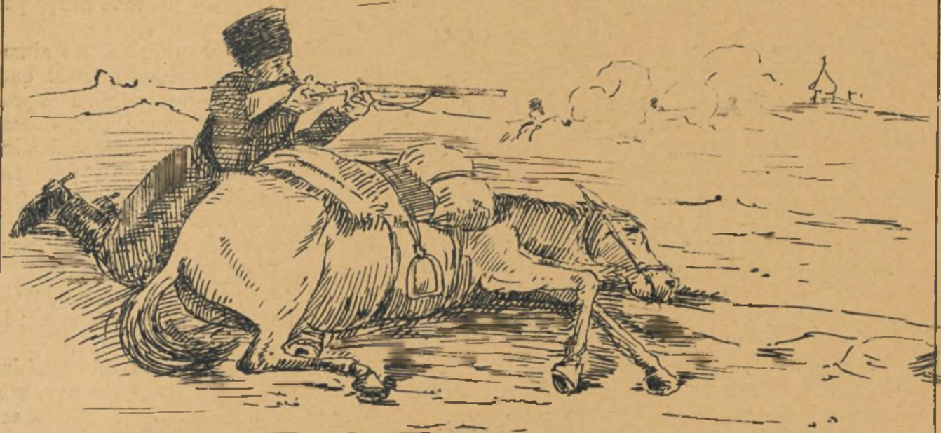
Fuego á cubierto del caballo