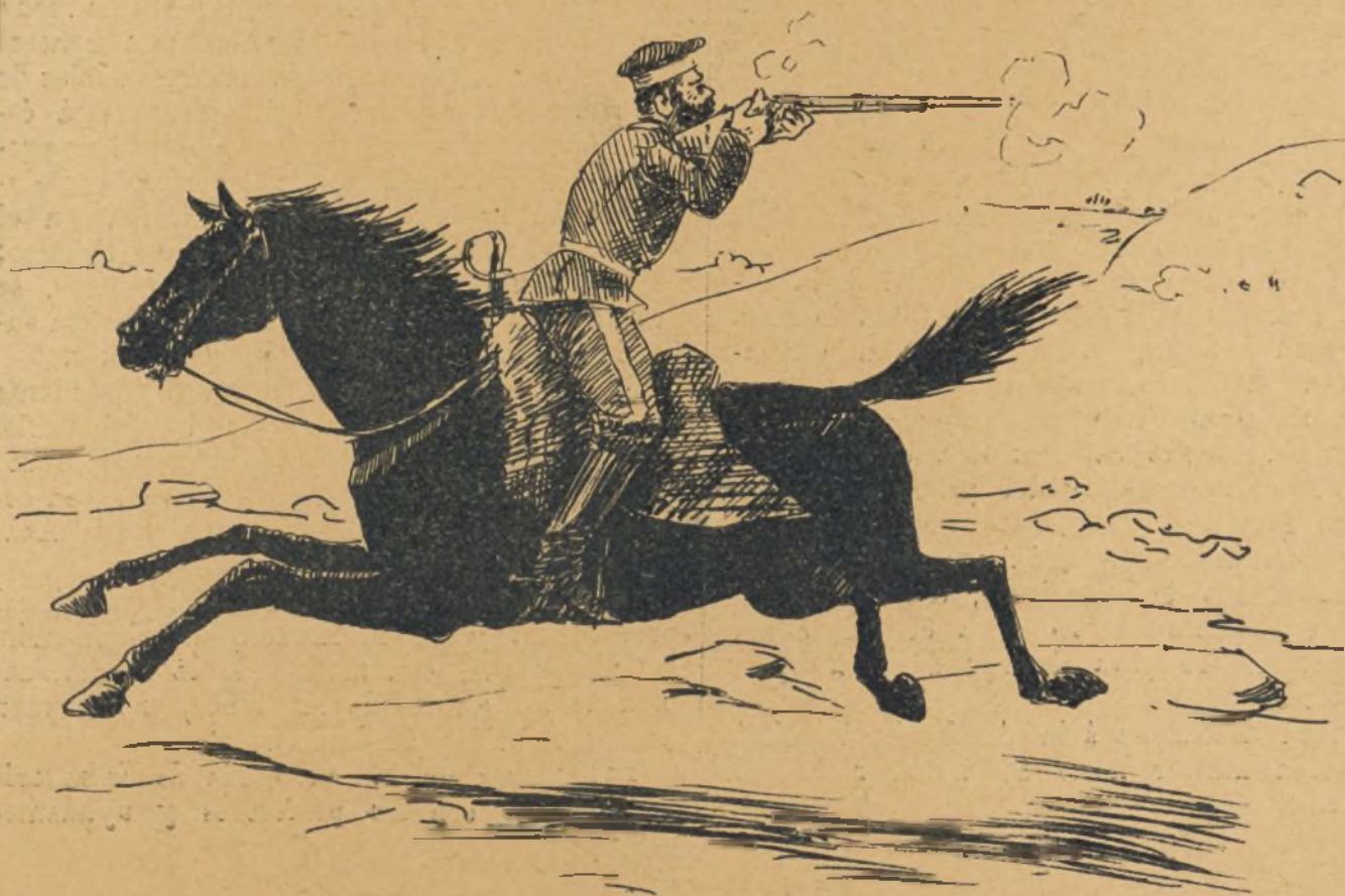
Fuego en retirada.