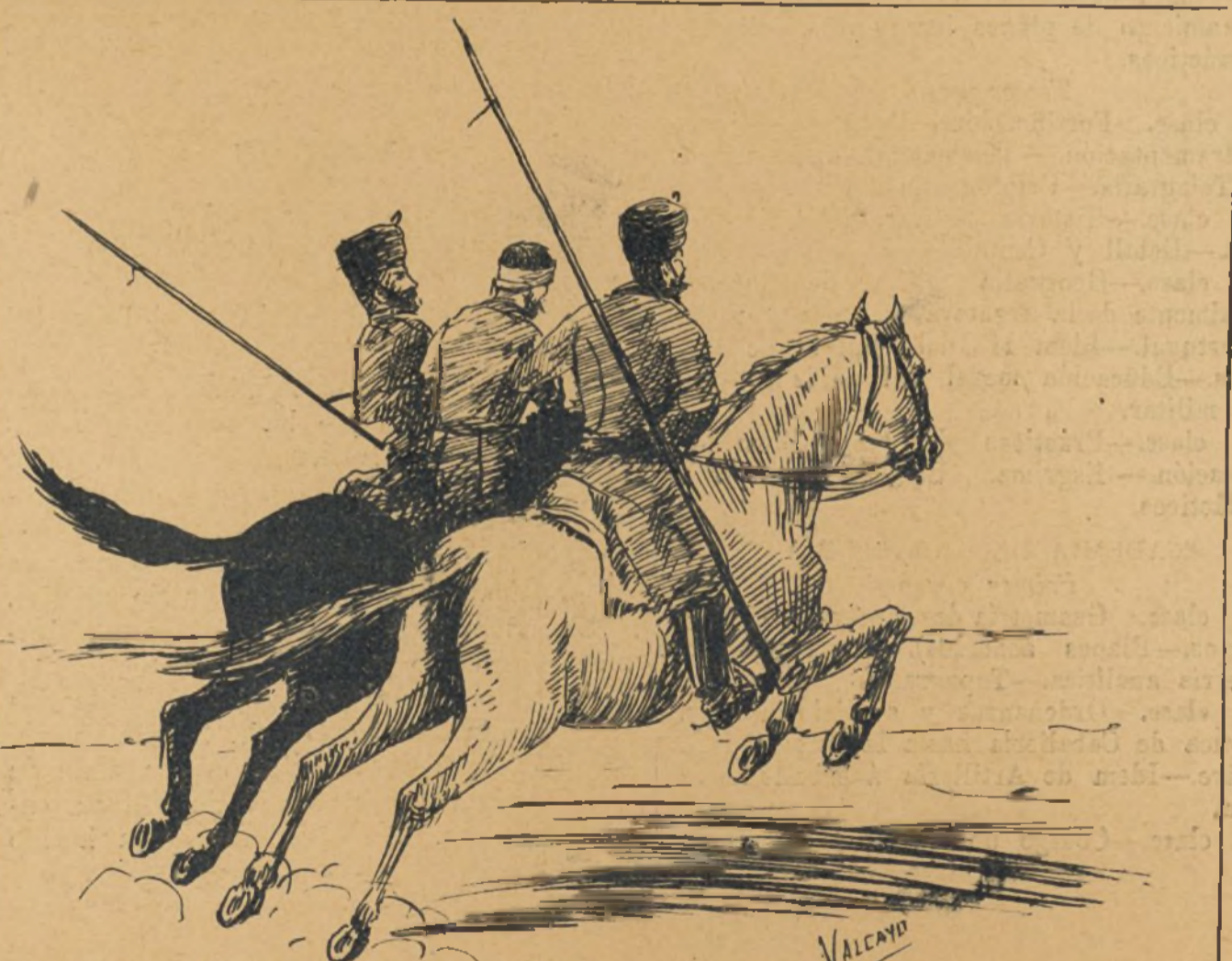
Conduciendo un herido.