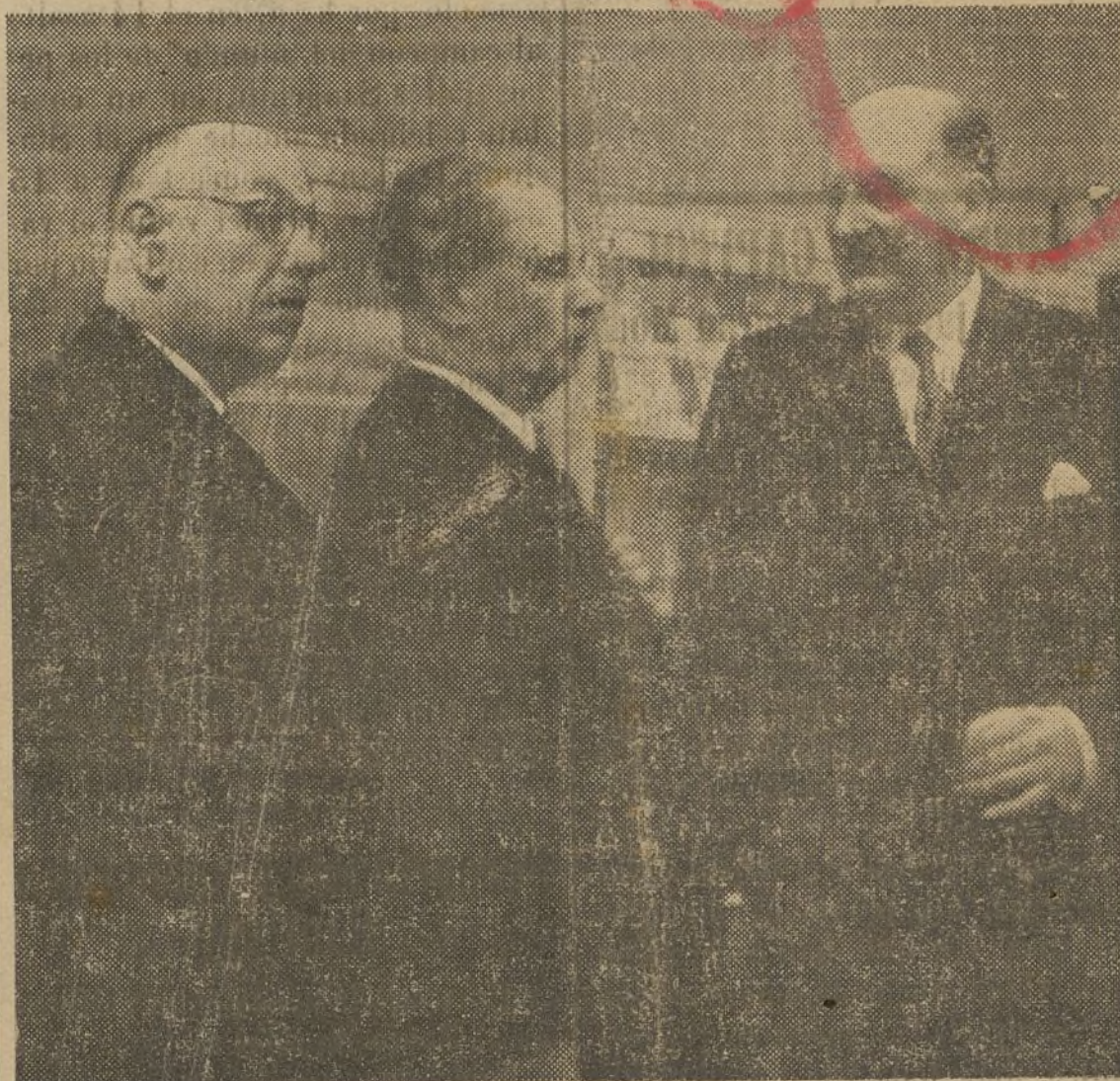
Tres de los principales personajes de las Conferencias de Ginebra. De izquierda a derecha, el secretario general Avenol, el representante de los soviets Potemkin y M. Flandin, ministro de Negocios Extranjeros de Francia.