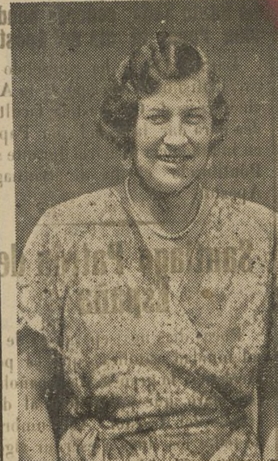
Princesa Eugenia de Grecia, que según rumores fidedignos, indicará la esposa del Rey Eduardo VIII de Inglaterra

hemos recibido, lo hacemos por la Prensa, agradeciendo a todos los que en estos momentos han demostrado su interés y adhesión en el dolor que por tan irreparable pérdida, sentimos. Igualmente, lo hacemos extensivo a los que personalmente lo han hecho.»