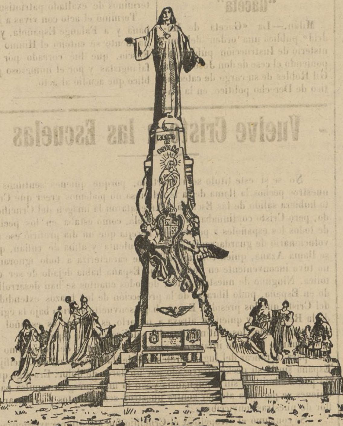
Presidiendo a toda España, desde lo alto del Cerro de los Angeles, se alza este monumento al Sagrado Corazón de Jesús, al que las tirbas rojas de Madrid hicieron blanco de sus odios, mutilándolo horriblemente.

Vea usted en 4.ª plana el anuncio de agua de colonia «La Carmela» contra las canas.