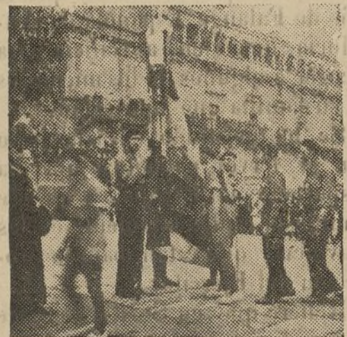
Momento de la jura de la verdadera bandera de España por los Requetes en la Plaza del Hospital

Roma.—La situación de Málaga es cada vez más trágica. Las fuerzas rojas se hallan desesperadas. La ciudad presenta un triste aspecto. Muchos edificios han quedado totalmente destruidos por las llamas.