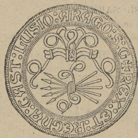
MONEDA DE LOS REYES CATOLICOS CON EL YUGO Y LAS FLECHAS

El número de flechas en los escudos variaba de cinco a ocho, pero el más corriente era de cinco,