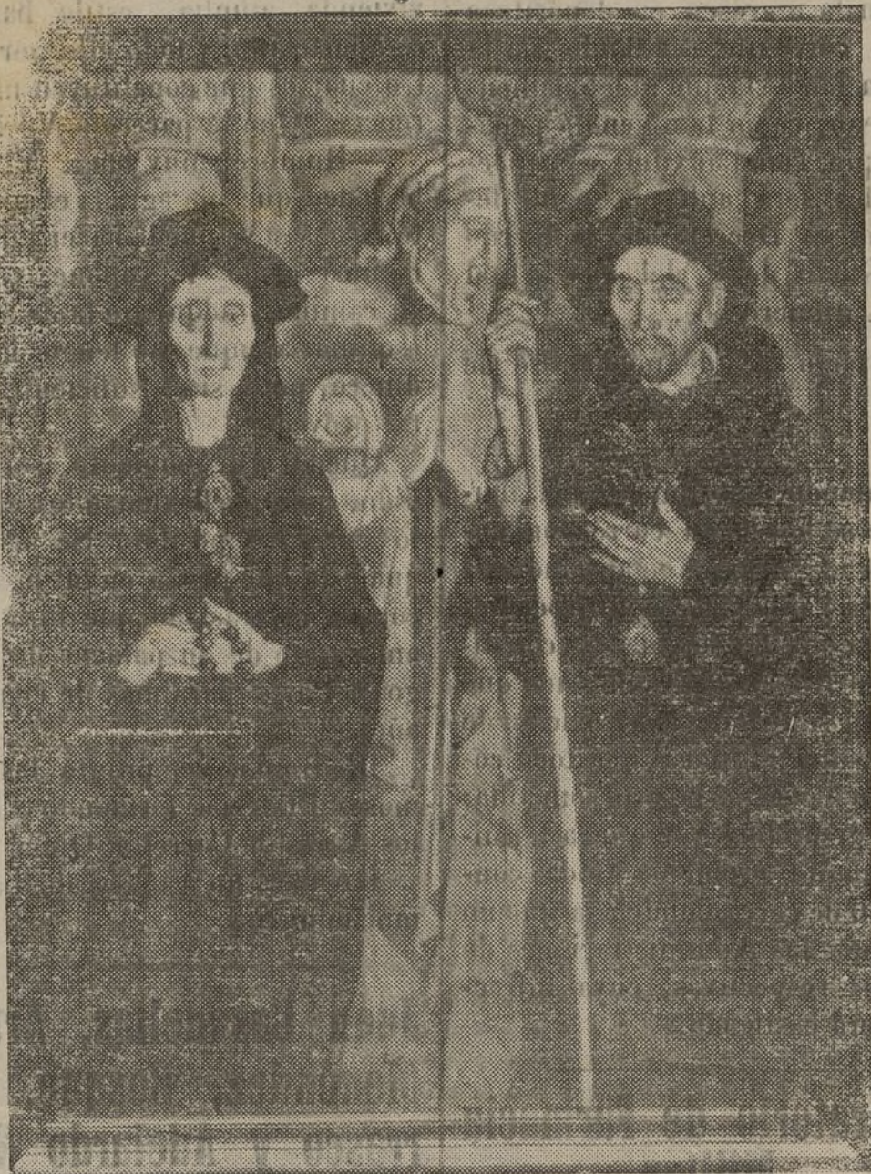
He aquí el magnífico cuadro de Jesús Corredoira, a que se alude en este artículo

Algunos pueblos, además de contribuir espléndidamente a la adquisición de aparatos, se preocupan de la construcción de aeropuertos, que vienen a ser los nidos de los pájaros armados. Ha llamado la aten-