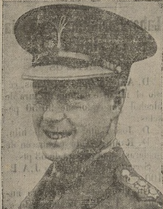
El Rey de Inglaterra Eduardo VIII

Ahora no se me puede tachar de culpable de lo que sucede.