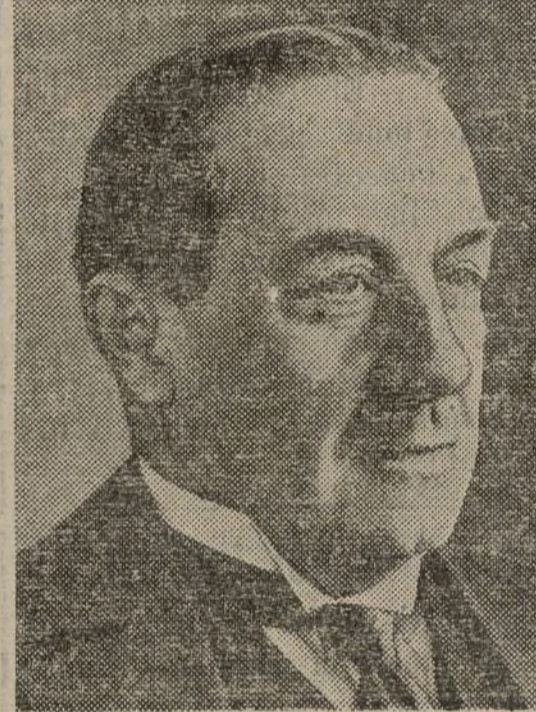
BALDWIN Primer ministro inglés

ferencia con el Rey a las 22 y cinco minutos, o sean más de dos horas. Seguidamente salió dirigiéndose a la Cámara de los Comunes a dar la noticia.