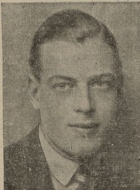
El duque de York, heredero del trono británico

Una profesora de primera enseñanza, 4 gruesas de imperdibles.