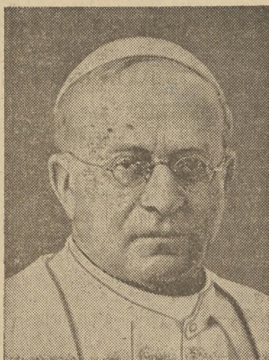
Sa Santidad Pío XI cuyo XVI Aniversario de su Coronación celebra hoy el Mundo Católico.

Después, entre otras cosas de verdadera substancia y en las que se analizan las operaciones, se las califica de «genialmente concebidas y ejecutadas». Y sigue: «La lista de las poblaciones conquistadas durante esas operaciones y las nuevas posiciones de la línea de fuego hacen creer que los nacionales obtuvieron sobre sus adversarios una rotunda victoria». Y si por sí ello fuera poco, añade algo que transcribimos literalmente: «Otro hecho importante a señalar es que los nacionales recuperaron