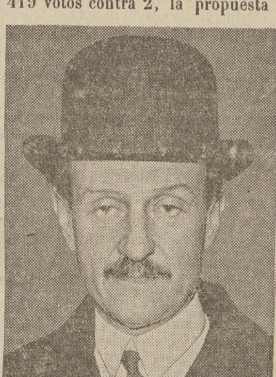
Chautemps, Presidente del Gobierno francés, cuyas últimas declaraciones confirman la funesta alianza rusa

Seguidamente se aprobó, por 419 votos contra 2, la propuesta