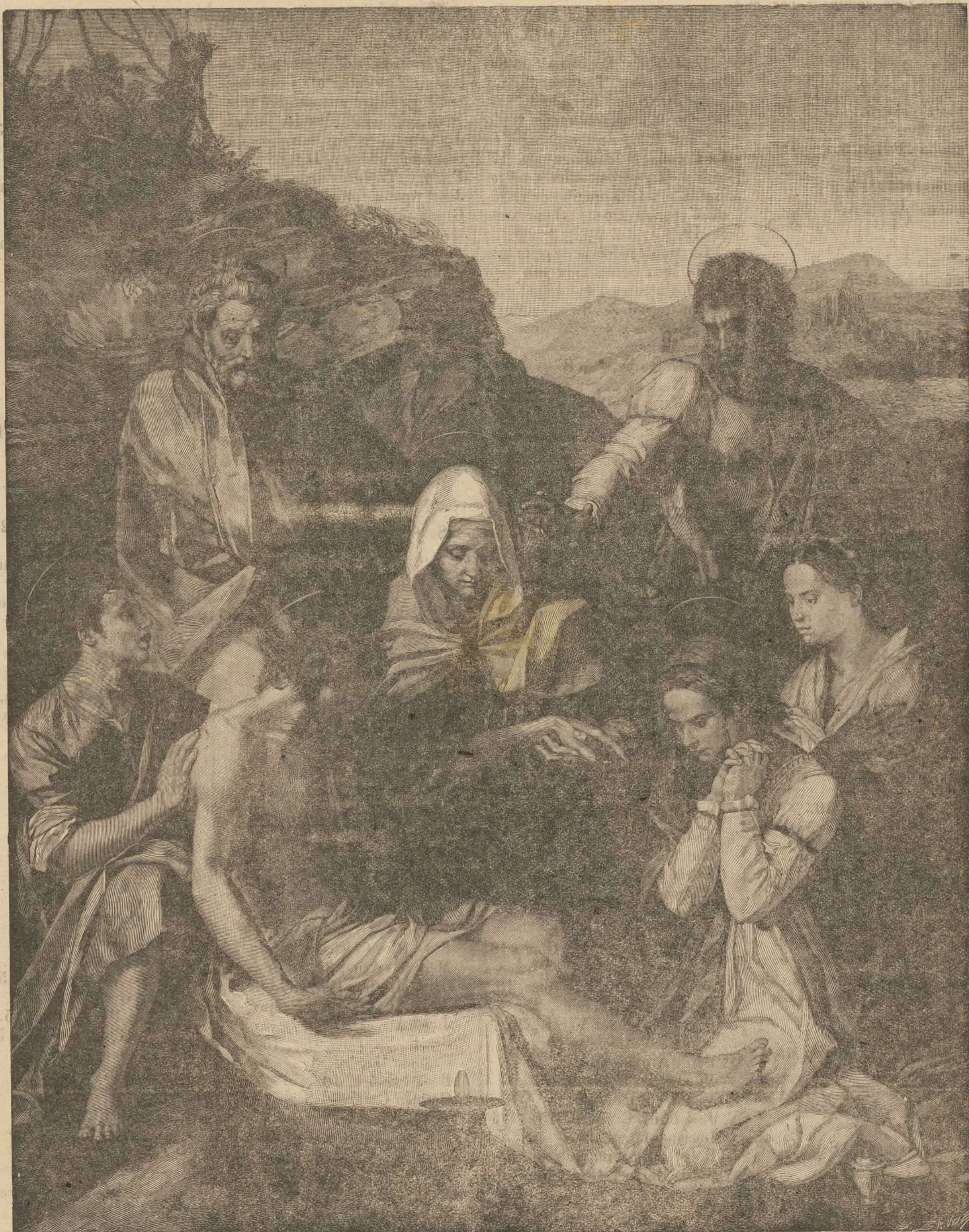
El Descendimiento, de Juan de Juanes

Al recogerse, saldrá para la iglesia de Salomé en procesión, la Virgen de la Soledad.