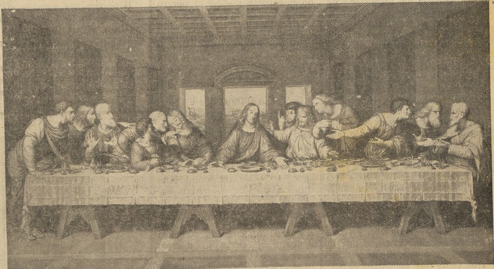
La última Cena, de Leonardo de Vinci

Si buscamos en el Catolicismo la razón de su vitalidad y su fuerza la encontraremos en la Eucaristía santa. Admitida ella lo comprendemos todo, como comprendemos el movi-