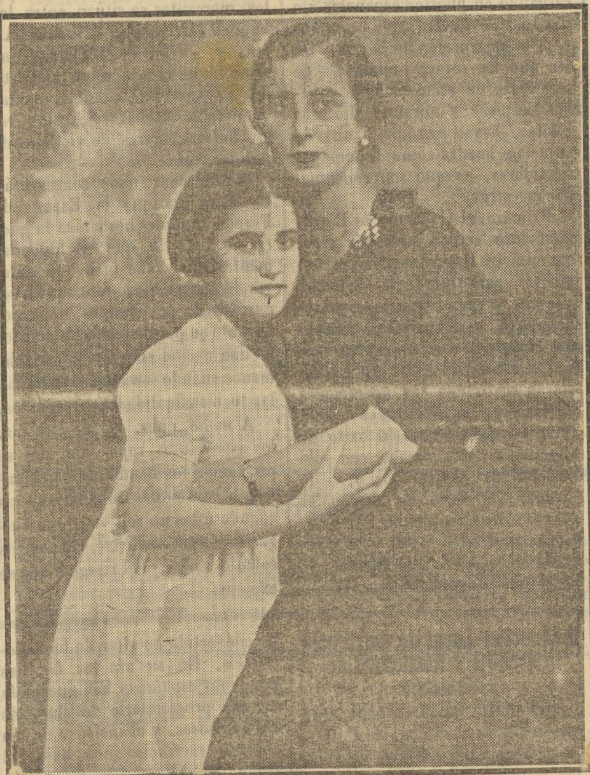
Excmo. Sra. D.ª Carmen Polo de Franco con su encantadora hija Carmencita

SALAMANCA, 8 DE JUNIO DE 1938.—SEGUNDO AÑO TRIUNFAL.