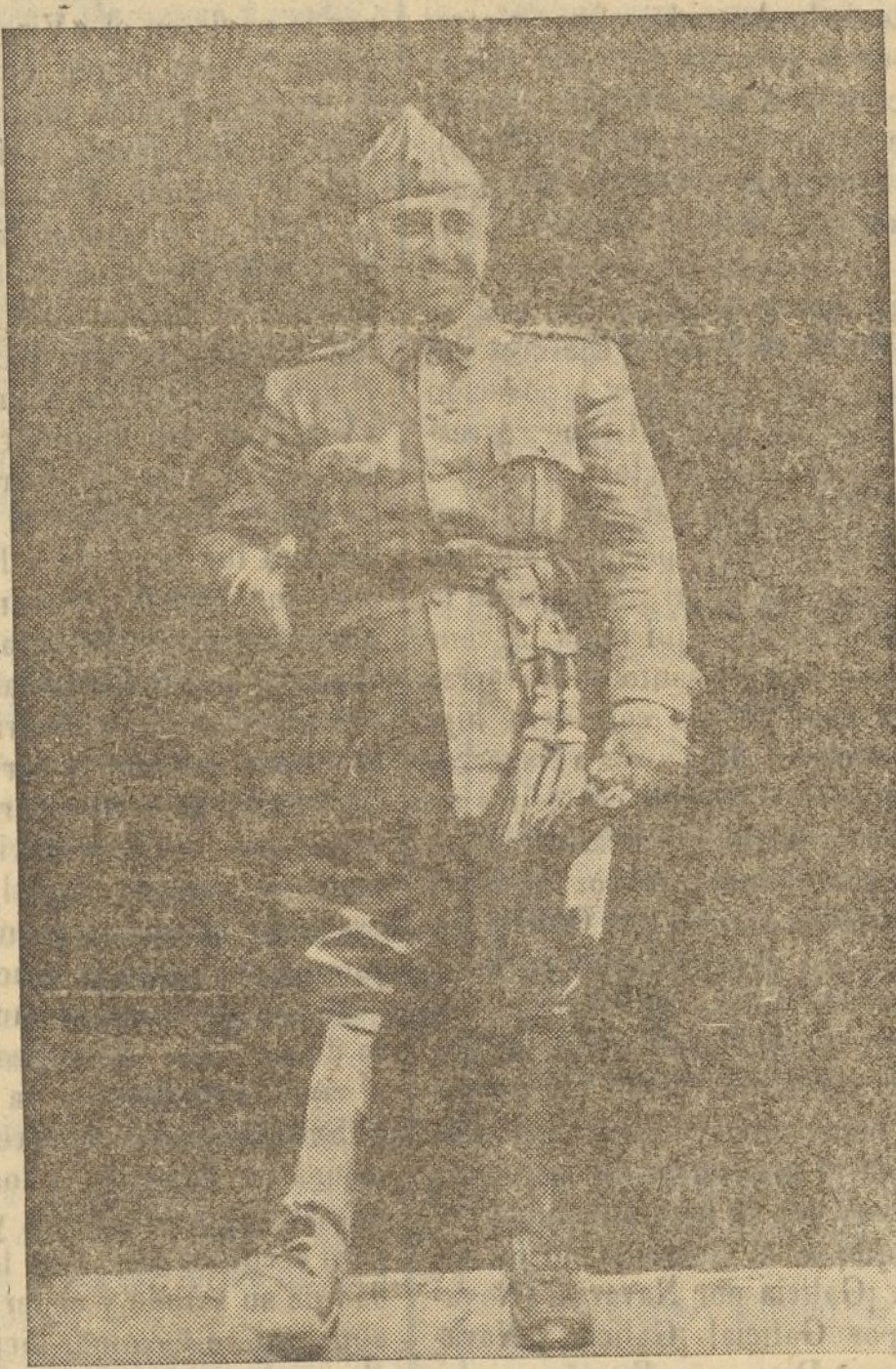
El Caudillo de España, Generalísimo de los Ejércitos que está forjando día a día la Unidad Nacional y que hoy nos da rescatada para España la capital leonvina de Castellón de la Plana.

Castellón vuelve al regazo matronal de España, después de haber vivido en la pródiga ausencia de sus equi-