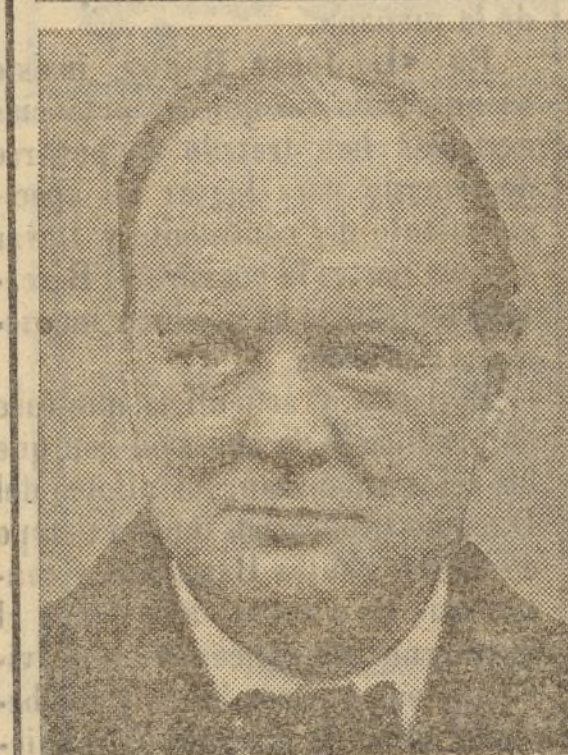
Wiston Churchill, que con ocasión de estar en juego los intereses de su país encontró justificados los bombardeos aéreos, ahora, cuando se efectúan en territorio ajeno al británico, los repudia y, adoptando una actitud incomprensible en una personalidad de su talla, al criticar la labor de Chamberlain, se hace impensadamente cómplice de la vesania de los dirigentes rojos de Barcelona, a los cuales habrá alentado con su reciente discurso en la Cámara de los Comunes.