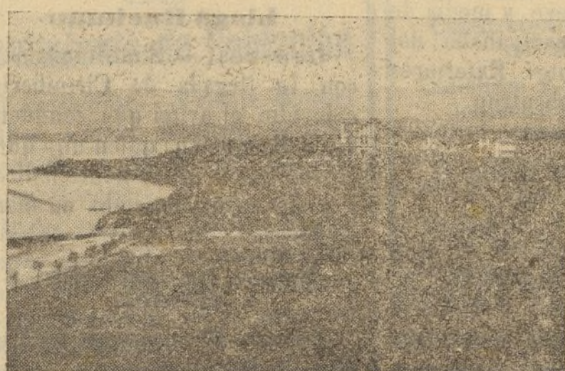
La Torre de Tanxil dominando la Ría.

No precisan ante sobre un peñón, pero si sobre un altonazo fron- doso, como puedes ver lector en el gráfico que se acompaña, mandó un