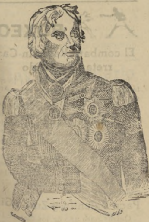
SIR HORACIO NELSON, ALMIRANTE DE LA ESCUADRA BRITANICA

Aquí, roto el vital lazo, NELSON héroe marino Yace; mas no todo entero Pues se echa menos un brazo. Perdiólo de un cañonazo; Cuando batido salió De Santa Cruz, y si halló Triunfos, los pudo adquirir En Trafalgar y Abukir; Pero en TENERIFE no.