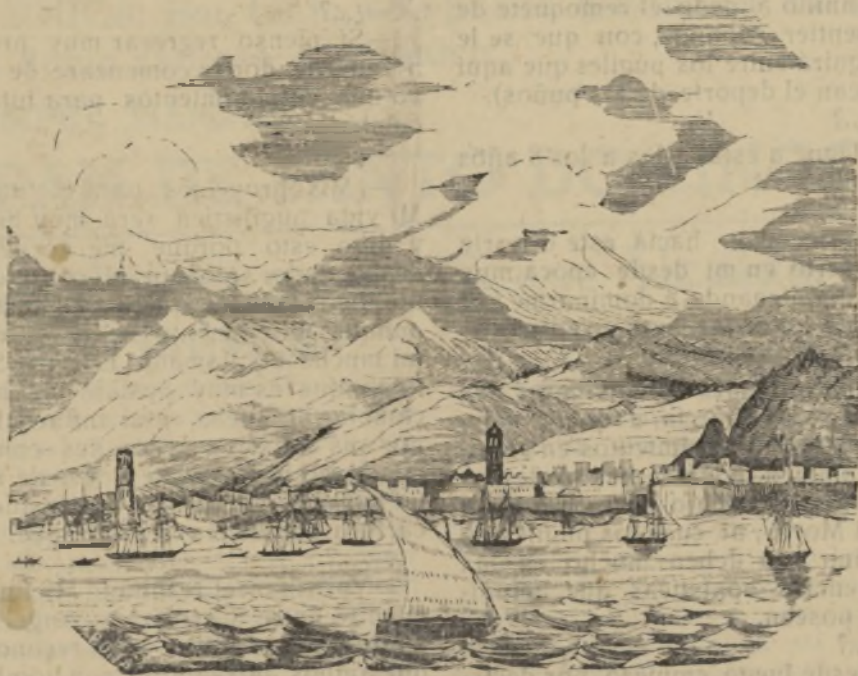
COMO ERA EL PUERTO DE SANTA CRUZ EN LA EPOCA DEL ATAQUE DE LA ESCUADRA INGLESA

Theseus 74 Ecullogen 74 Línea Ze-lous 74 Leandro 50 Seahorse 38 Eme-