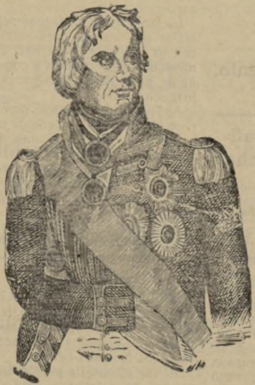
Sir Horacio Nelson, Almirante de la Escuadra Británica

El año 1797, funesto para las armas españolas, a causa de la guerra que sostenía con la Gran Bretaña, ocasionó al comercio español la inseguridad en los mares, pues cruzando numerosas escuadras en todos ellos y no descuidando los ingleses los puntos de la precisa recalada de los buques a las costas españolas, su ganancia era tanto más segura, cuanto más segura, cuanto mayor era su importancia.