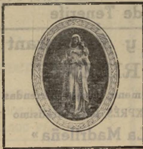
LA VIRGEN DEL PINO