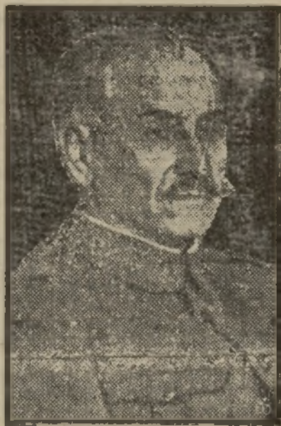
El general Queipo de Llano, genial locutor de nuestra Cruzada.

manda a los ansiosos a la cama a dormir en paz. Como el más inteligente y paternal de los doctores. ¡Cuántas veces, en efecto, la voz de la radio ha conseguido que inclinásemos la cabeza en la almohada con un suspiro de satisfacción y que nuestro sueño fuera sosegado!